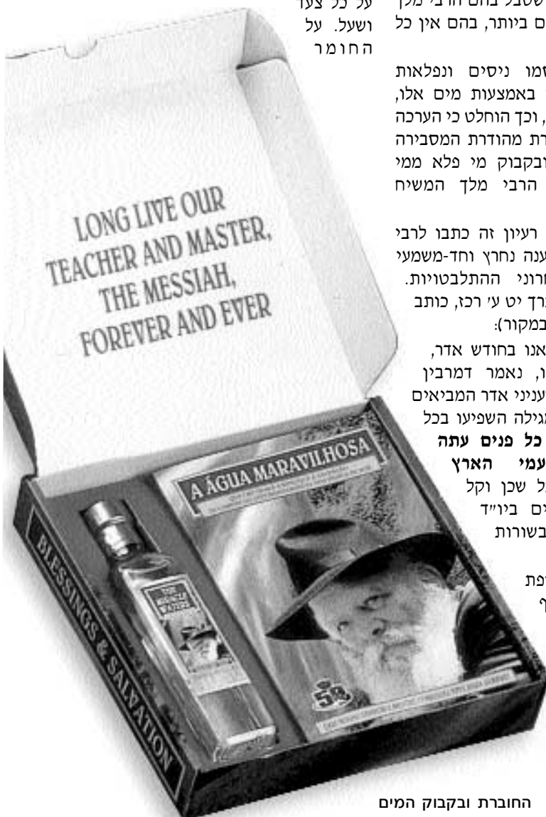
החוברת ובקבוק המים בתוך הערכה המהודרת

היות וכמו בכל מבצע גם כאן צריכה להיות הדגשה על האמונה ברבי כמלך