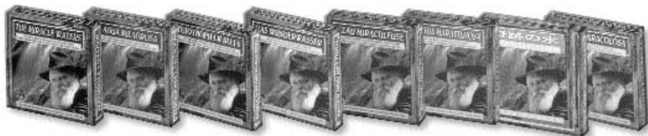
ערכת שבע מצוות, בשמונה שפות – אנגלית, צרפתית, ספרדית, פורטוגזית, רוסית, גרמנית, איטלקית ויפנית