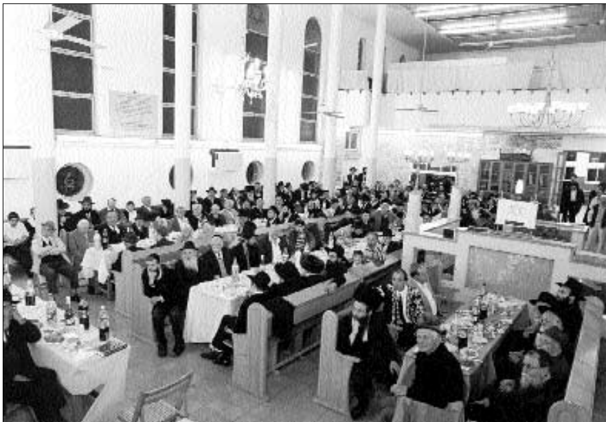
הקהל בהתוועדות המרכזית בתל-אביב