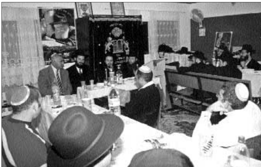
התוועדות בבית חב"ד גן יבנה