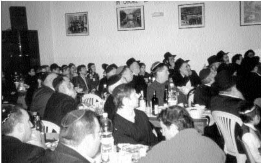
הקהל הרב בהתוועדות י"ט כסלו במילאנו איטליה