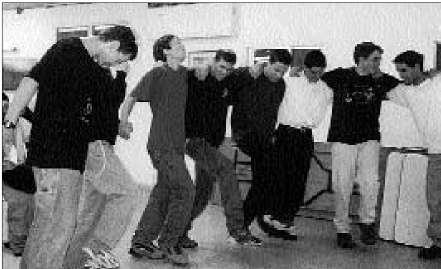
ריקודי שמחה סוערים בתום ההתוועדות באלון שבות