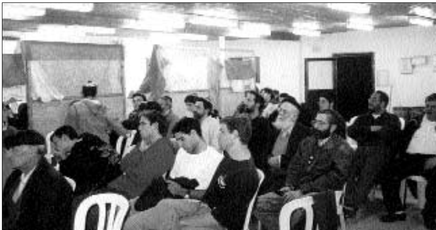
צעירים ומבוגרים בהתוועדות שנערכה ביישוב אלון שבות