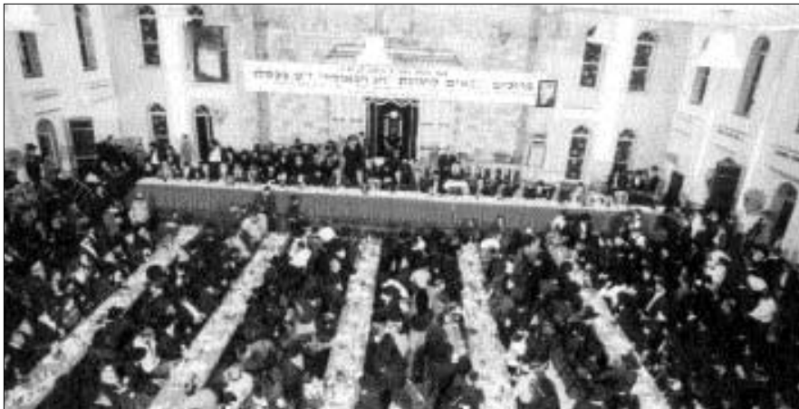
קהל האלפים בהתוועדות י"ט כסלו בכפר-חב"ד