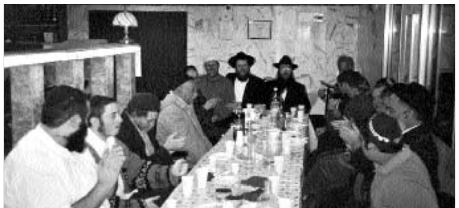
התוועדות באווירה חמה ומרתקת – בזכרון יעקב

ההתוועדות הרשמית הסתיימה בצפיה במראות קודש – בהקרנת סרט וידאו בהפקת המכון "לראות את מלכנו".