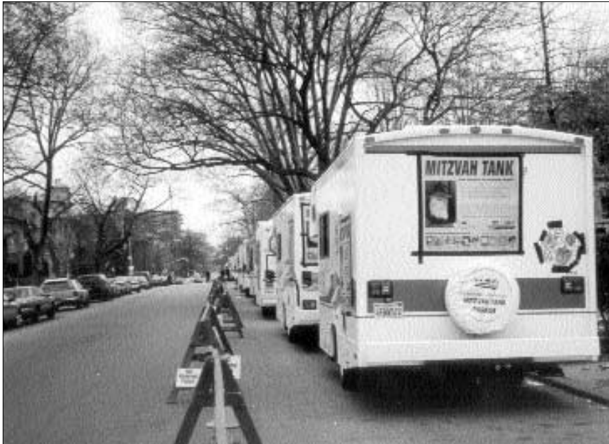
שיירת הטנקים בניו-יורק בטרם היציאה ברחוב פרזידנט

שמואל בוטמן ומסוקר בהרחבה רבה בכלי התקשורת האלקטרונית.