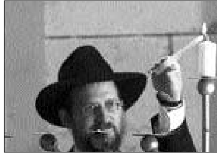
למעלה: רבה הראשי של רוסיה הרב בערל לזר לצד נשיא רוסיה ולדימיר פוטין שכובד בהדלקת השמש של החנוכה