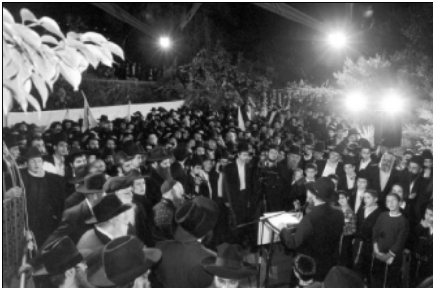
עריכת הסיום על ציון הרמב"ם בטבריה