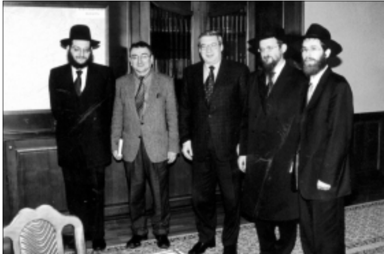
פגישה עם מושל המחוז.