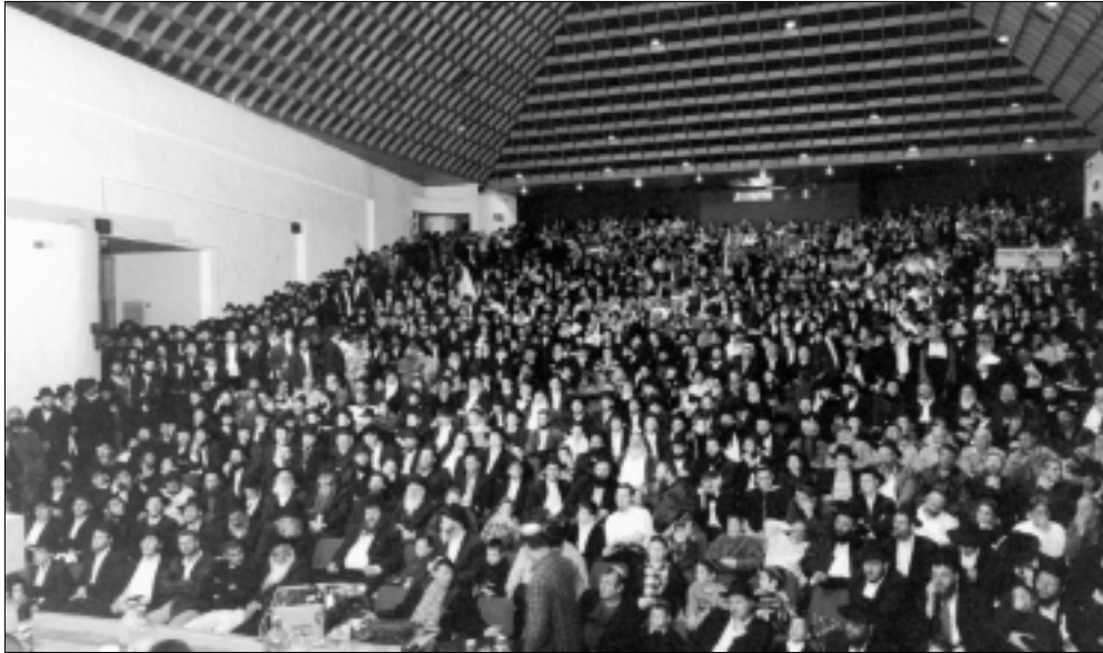
חלק מהקהל הרב בכינוס שנערך באולמי "יד שטרית" בטבריה

שיבח את תקנת לימוד הרמב"ם היומי שנתייסדה על ידי הרבי, וקרא להתחזק בשמירה מסלולי הלימוד השונים.