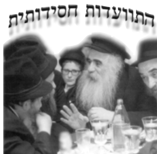
עם הרב לוי יצחק גינזבורג

הגיעה השעה אשר החלש יאמר גבור אני, להקים את דבר ה' הנאמר ע"י עבדיו הקדושים הוד כ"ק רבותינו,