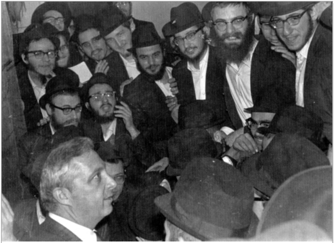
אריאל שרון בהתוועדות עם תמימים ואנ"ש ב-770, לאחר צאתו מהיחידות אצל כ"ק אדמו"ר שליט"א

למה נפלו שם שמונה חיילים. כאשר הסברתי לרבי שהיינו מוכרחים לעבור דרך ערוץ ואדי מסויים, והיה שם מארב של האויב – שאל אותי הרבי: ומדוע הייתם צריכים ללכת דרך הוואדי, הרי יכולתם לכבוש את העיר מכיוון אחר... והרבי צייר לי בידו את התוואי המדוייק בו היו צריכים לכבוש את קלקיליה, כאילו היו מול עיניו את המפות המדוייקות ביותר של האיזור!