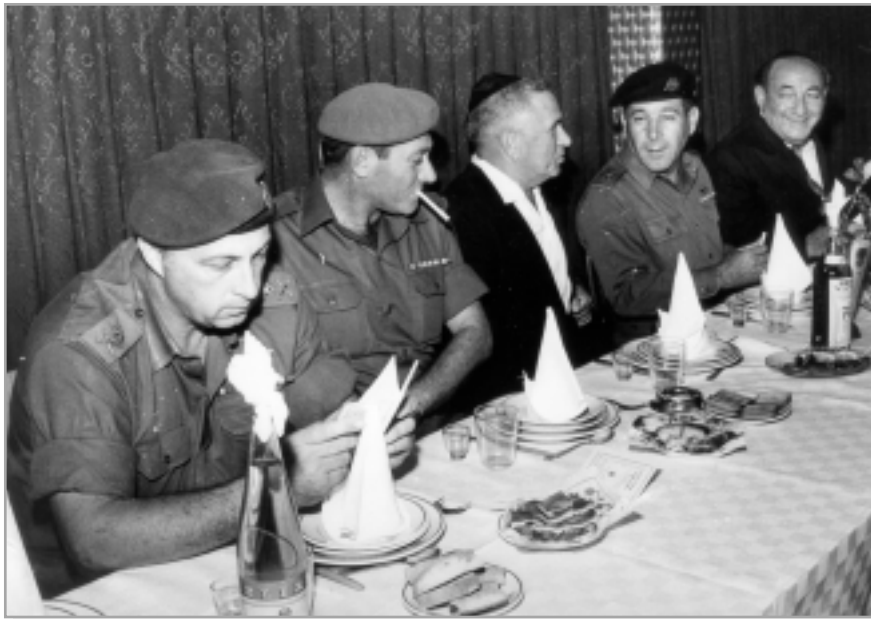
האלוף שרון (משמאל) בבר-מצוה לילדי הגיבורים שנערכה בכפר-חב"ד