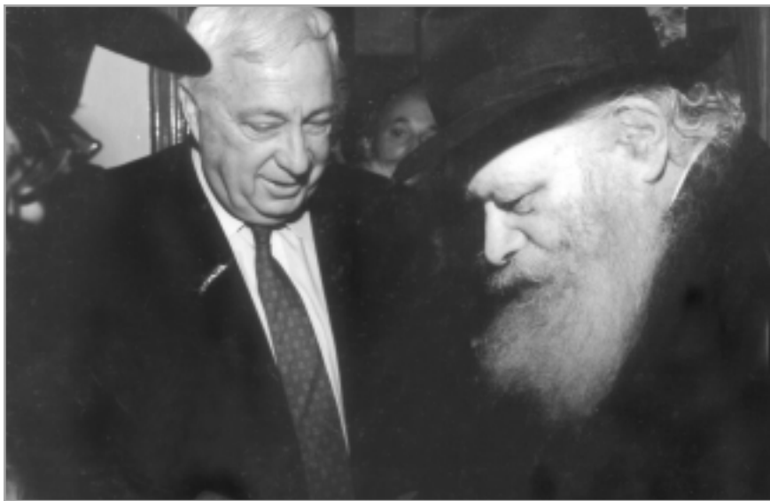
אריאל שרון אצל הרבי, בחלוקת הדולרים ביום ראשון, ערב ראש חודש סיון תשמ"ט

לאחר תקופה ממושכת מונה אריק שרון למפקד חטיבת 'גולני'. פעולות התגמול הובילו בסופו של המהלך לימבצע סיני. שרון עמד אז בראש הצנחנים ופיקד על הצניחה הראשונה שהייתה בתולדות ישראל.