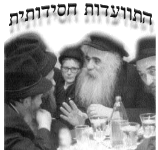
עם הרב לוי יצחק גינזבורג