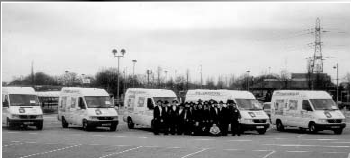
"הוא יוליכנו בטנקים לארצנו". תהלוכת טנקי-מבצעים בלונדון

"נו, מה אני כבר יכול לעשות? ציירתי לעצמי מול עיניי את דמות קודשו של הרבי שליטי"א, ושאלתי במחשבה: 'רבי! מה רצונך שאעשה? אני מבקש שהדברים שאומר עכשיו יפעלו פעולתם!'. כעת פניתי אל המוכר בעוגמה ואמרתי: 'אני מרגיש כמו אדם צמא במדבר שמציעים לו זהב ויהלומים!...' המשל הזה הזיז בו משהו. הרגשתי את זה עליו. הוא