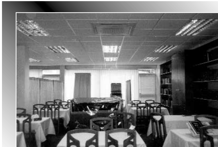
בית מקדש מעט. מראה פנים בית-הכנסת

לי עם יהודי מקהילה זו. לפני כמה שנים הוא פגש בי ברחוב ושאל בנימה צינית: 'נו אז מה קורה? יש הצעות ל...! הבטתי בו ואמרתי לו בתוקף: 'יש לנו רק רבי אחד, הוא מלך המשיח והוא חי וקיים'. הוא חיך והמשיך הלאה.