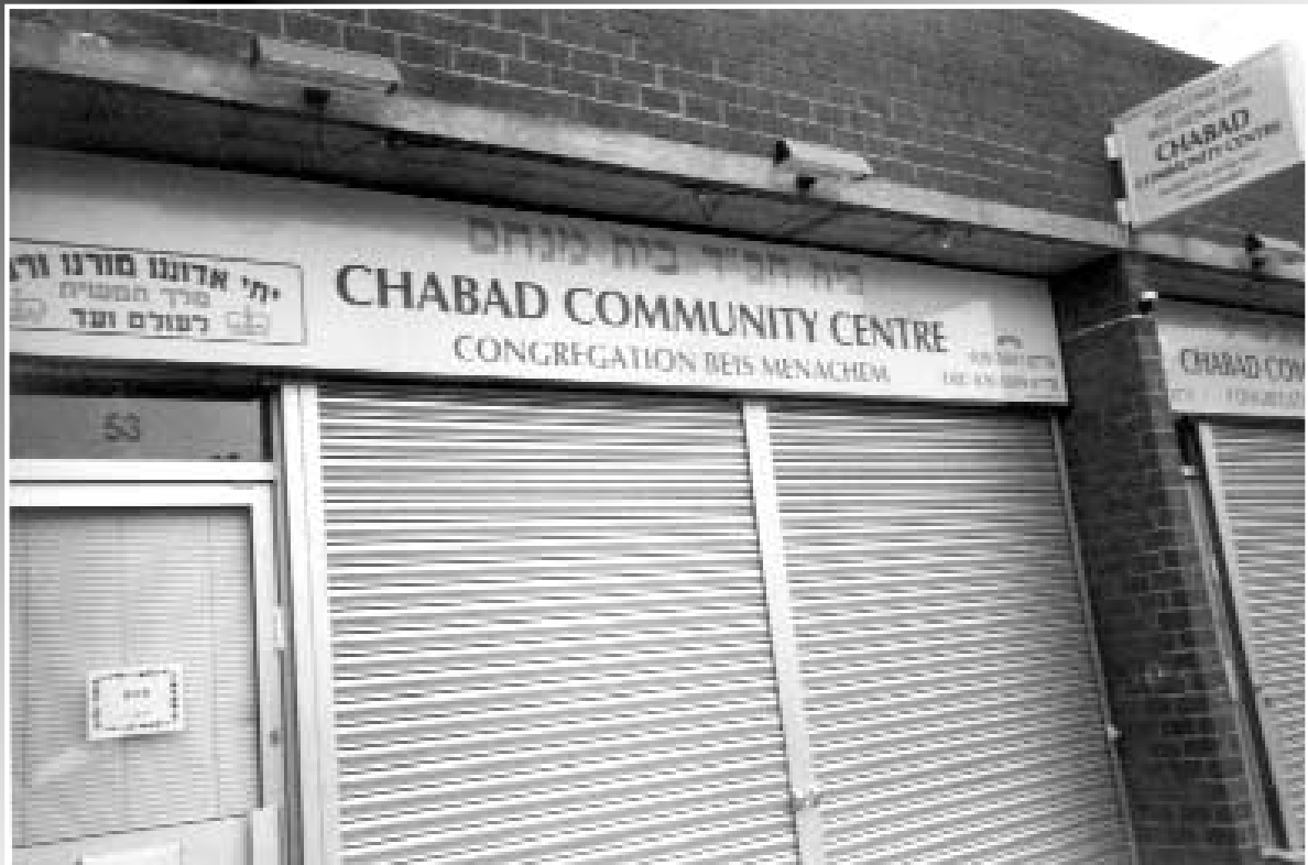
חזית בית הכנסת "בית מנחם"