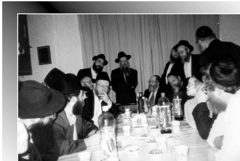
שבת אחים גם יחד. התועדות בבית-הכנסת

"פעולה נוספת שלנו היא עיתון שבועי שאנו מוציאים לאור ומפרסמים ברחבי לונדון. העיתון הינו נאה ומושקע, ומכיל