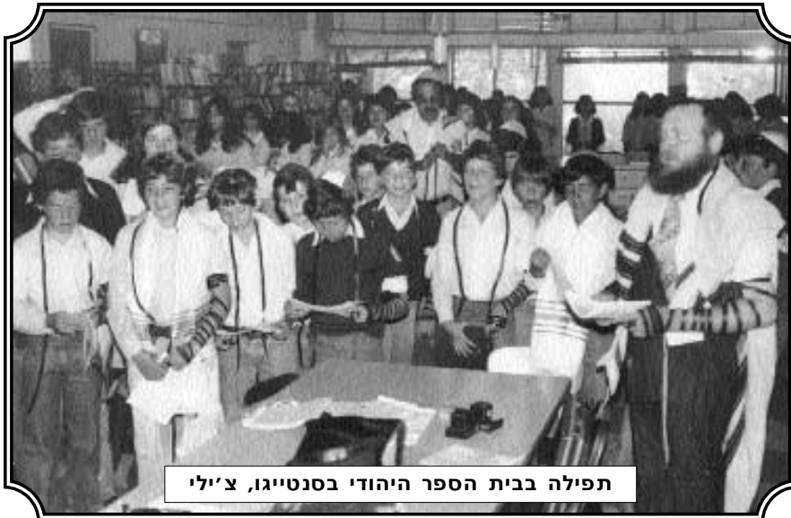
תפילה בבית הספר היהודי בסנטיגו, צ'ילי

"לפתע שמענו צעקות רמות 'אני יולדת, תעזרו לי – קחו אותי לרופאה'. זיהינו מיד את קולה של שכנתנו שהיתה יודת המשפחה. בד בבד עם הצעקות שלה, פסקו הדפיקות והמהלומות בדלת ביתנו. רק לאחר