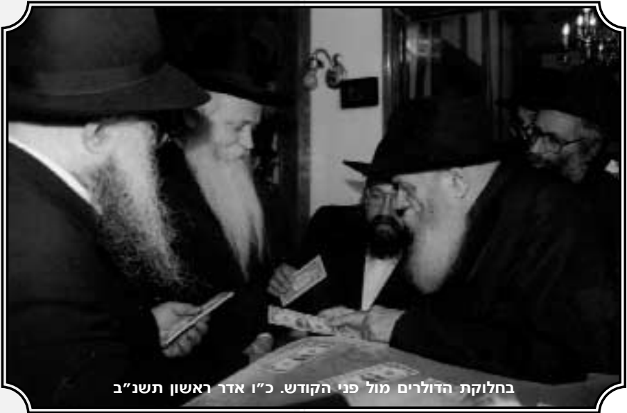
בחלוקת הדולרים מול פני הקודש. כ"ו אדר ראשון תשנ"ב

רק לאחר כמה ימים נודע את אשר אירע. הרגשתי שהרבי מבקש שאבוא אליו כדי להעניק לי כוחות להמשך הדרך. במה זכיתי? – לא אדע.