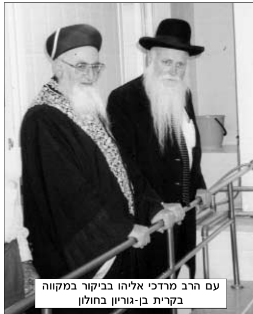
עם הרב מרדכי אליהו בביקור במקווה בקרית בן-גוריון בחולון

מוקדם, מאשר לפעול בקרב זוגות הנשואים שנים רבות.