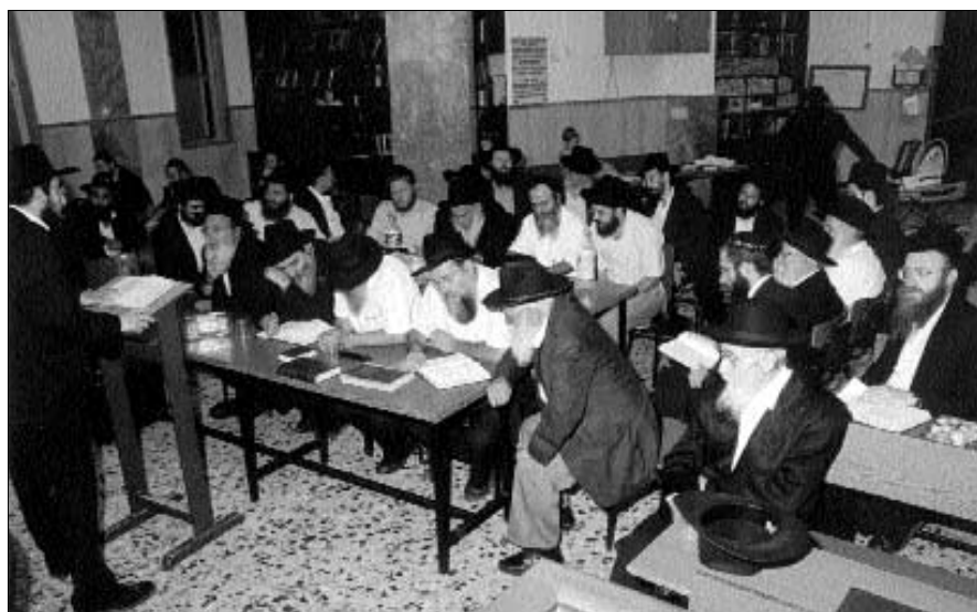
שיעור אחד מיני רבים בעניני גאולה ומשיח, המתקיים מידי שבוע בבית הכנסת "בית מנחם" בכפר חב"ד