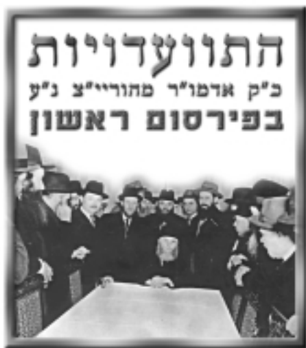
התוועדות כ"ק אדמו"ר מהוריי"צ נ"ע בפירסום ראשון

לקראת חג הפורים הבעל"ט הננו מדפיסים בפירסום ראשון פרק נוסף משיחות הקודש של הרבי הריי"צ • חג הפורים תש"ח