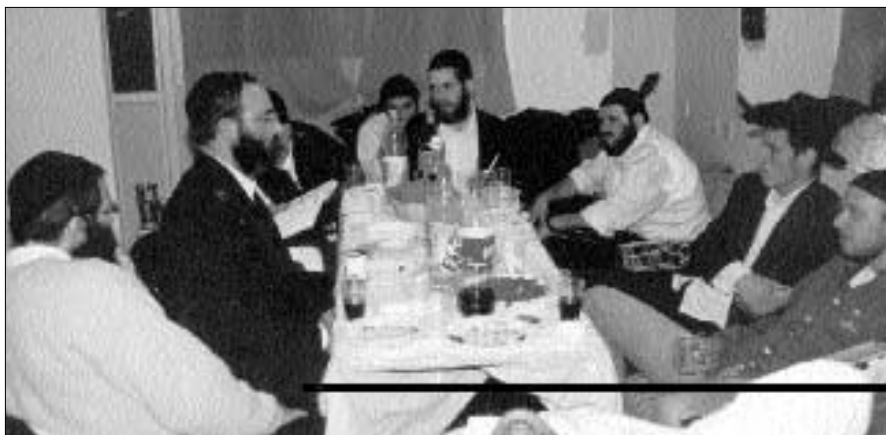
בהתוועדות חסידית לבית

מקומה. לאחר טבילה במקווה האר"י פנו האורחים להתארגנות בחדרים המיוחדים שסודרו קודם לכן, בתיאום עם הנהלת הישיבה בצפת.