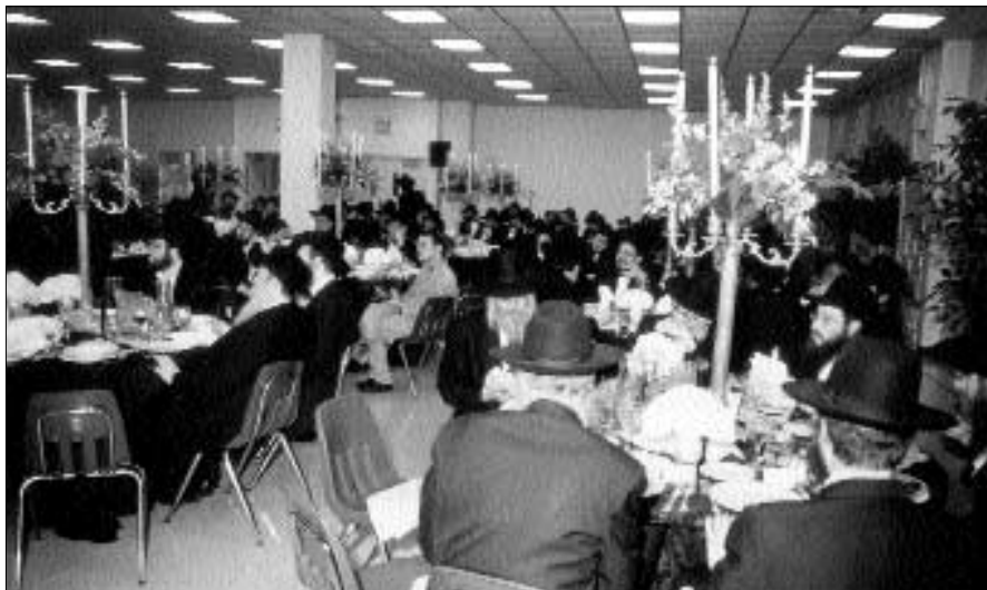
חלק מהקהל בסעודת הדינר' החגיגית

באירוע מרשים במיוחד התקיים דינר וערב הוקרה לצוות המחנכים בליובאוויטשער ישיבה בסניף שברחוב קראון שבשכונת קראון הייטס, כך שהאירוע הפך לערב הצדעה לפועלם והשקעתם.