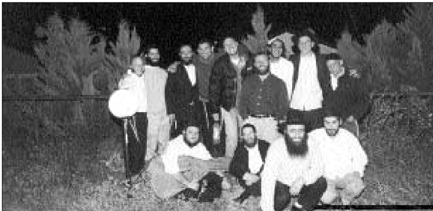
תמונה קבוצתית של משתתפי השבת

שבת מרוממת-נפש עברה על תלמידי המכללה ללימודי יהדות ברמת אביב, בעת שהתארחו בשיבת חבי"ד בצפת. כחמישה עשר תלמידים – חלקם צעירים שהתקרבו ליהדות על ידי בית חבי"ד בפונה שבהודו.