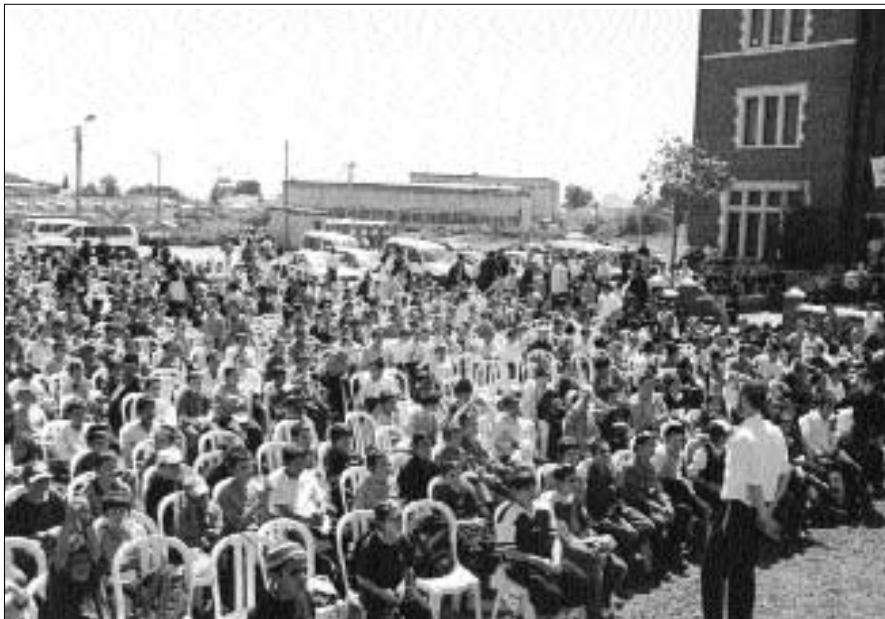
אלפי ילדים ברחבת 770

כינוס ילדים מפואר בארגון מטה משיח בשיתוף תנועת הנוער צבאות השם למעלה מאלף וחמש מאות ילד מכל רחבי הארץ השתתפו בכינוס רב רושם ברחבה שבחזית בנין 770 בכפר חב"ד • בכינוס שהתקיים לקראת י"א ניסן – יום הולדתו של הרבי, נחשף מבצע יחודי – עשיית מאה מעשים טובים לזירוז הגאולה