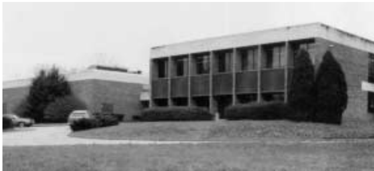
ישיבת אחי תמימים בניו הייבן

בההרצאות הבע"ל שלו - כדאי שידגיש בכא"א מהן שהעיקר - המעשה (וכהודעת חז"ל