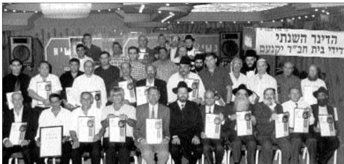
התמונה המשפחתית השנתית של יידי בית חב"ד יקנעם

בדיבורו ניכרת התרגשותו הרבה. דקות ארוכות הוא מתאר את אותם רגעים מיוחדים בהם שוהה הוא אל מול הקודש. הוא לא שוכח לציין בסוף דבריו, שברכות