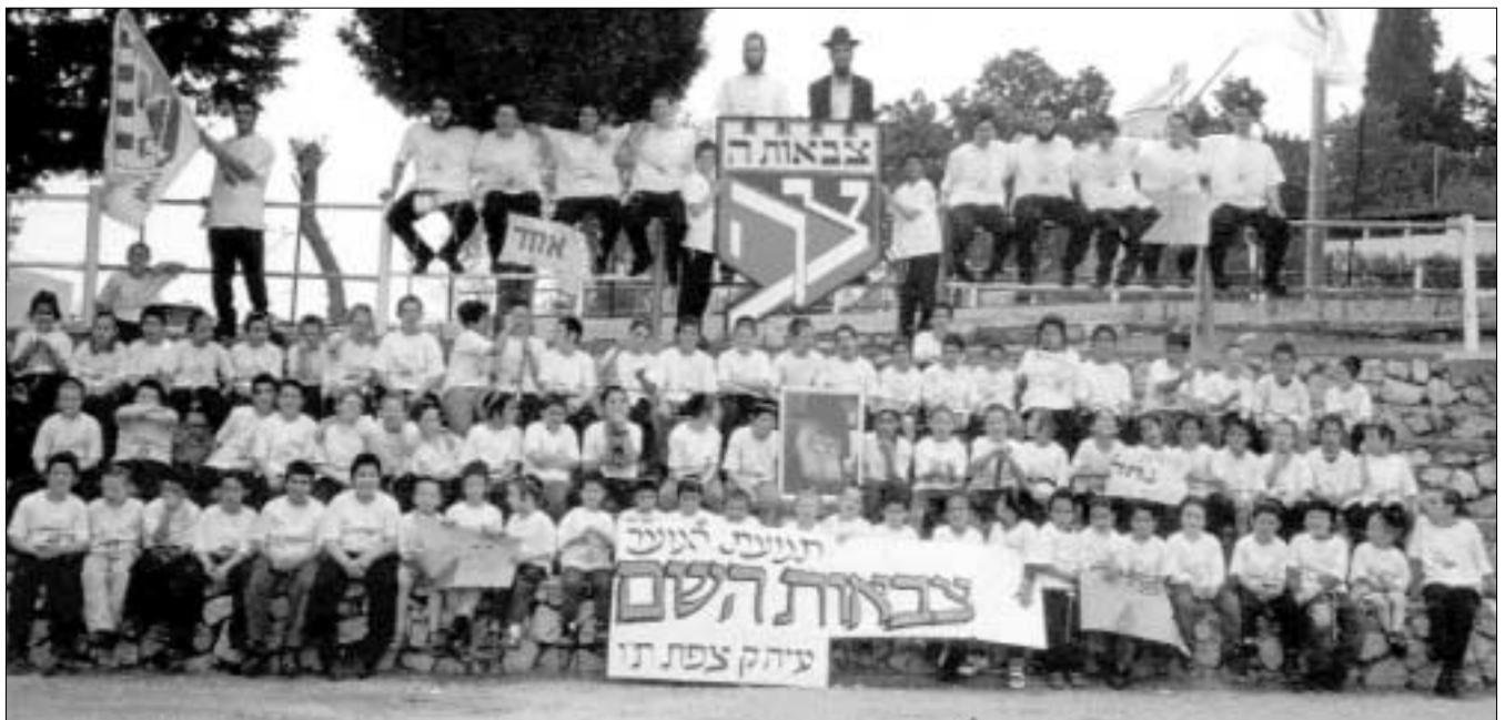
תלמידי קייטנת גן ישראל לפני חג הפסח