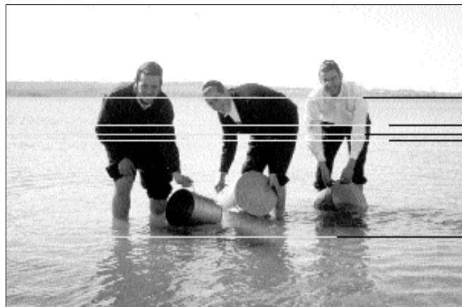
הטבלת כלים בפרבומייסק קודם חג הפסח