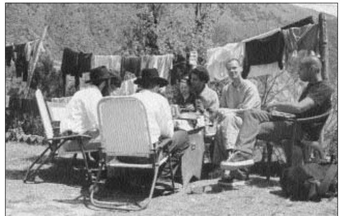
לימוד חסידות עם מטיילים ישראלים בדארמסלה

הישראלים המטיילים סייעו רבות בהכנות לקראת ליל הסדר. הם קילפו ירקות הכינו גפילטע פיש, והקימו את האוהל הענק ואף קישטו אותו. קודם לכן נבנה מקרר ענק במיוחד עבור תבשילי ליל הסדר.