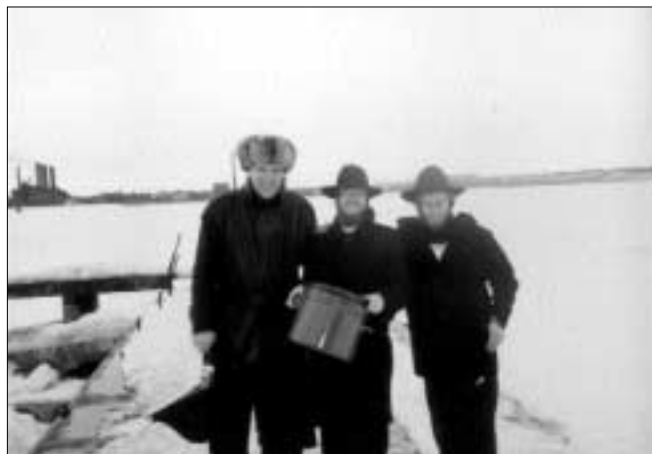
מטבילים כלים באיזוסק קודם חג הפסח