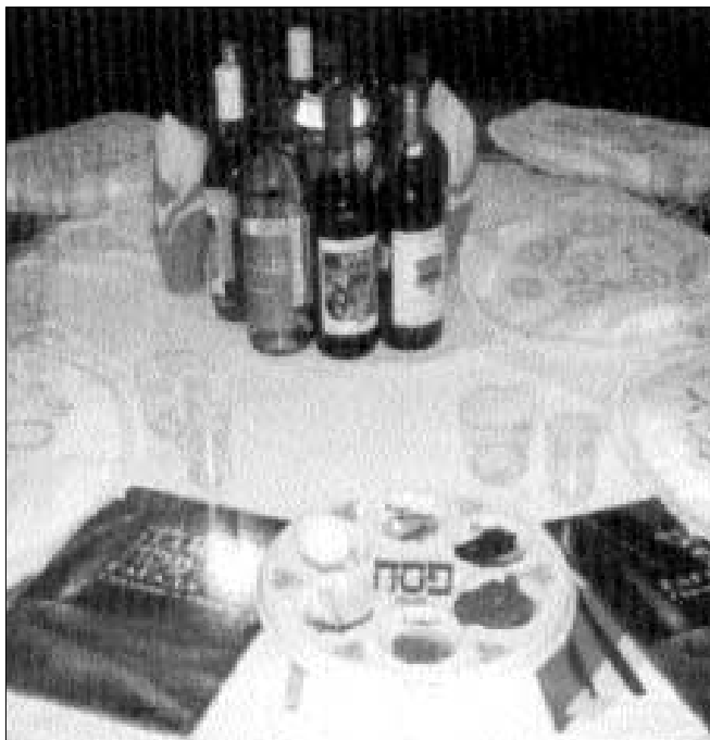
לקראת שולחן הסדר באחד מהסדרים הציבוריים ברוסיה