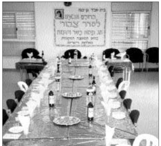
שולחן הסדר הציבורי ביבנה קודם הכנס השבת

מספר השליח הרב שניאור קורנט: "בימים שלפני חג הפסח, הודיעה במפתיע אשה המקורבת לבית חבי"ד כי היא תורמת סכום כסף גדול על מנת שבית חבי"ד יחלקו לנזקקים. עוד באותו יום חולקו תלושי קניה בין עשרות משפחות נזקקות. עבור משפחות אלו היו התלושים תשועה והצלה".