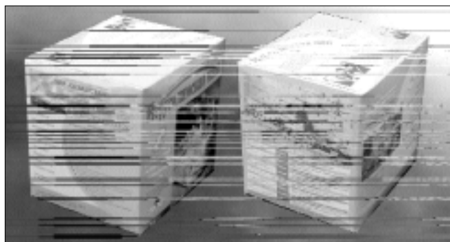
המצות שנשלחו ליהודי קזחסטאן. הקרטון נשא את כל התאריכים החשובים בחודש ניסן

מספר הרב שמואל קוט: "זמן קצר לאחר שהגעתי לאסטוניה, החל אחד היהודים להצר את צעדיי. פעם אפילו צעק לעברי 'חב"ד מעולם לא פעלה באסטוניה, ולכן אין לך רשות לפעול פה'. בליל הסדר הוא ניגש אלי והודה לי בחום על חלוקת המצות ליהודי העיר ועל סדר פסח שנערך ברוב רגש..."