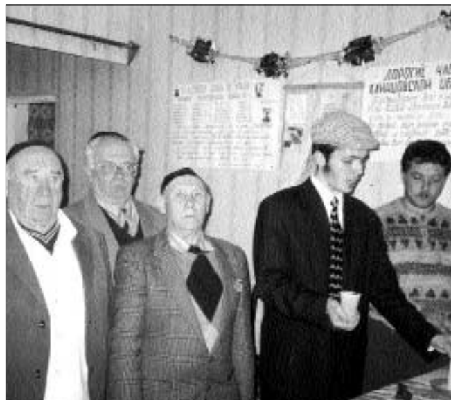
הבדלה במוצאי חג הראשון של פסח

הזקנה הביעה את שמחתה על כך שזכתה להזכר בימים עברו, ולהשתתף בליל הסדר שנערך אי-שם ליהודים שאינם יודעים על יהדותם מאומה.