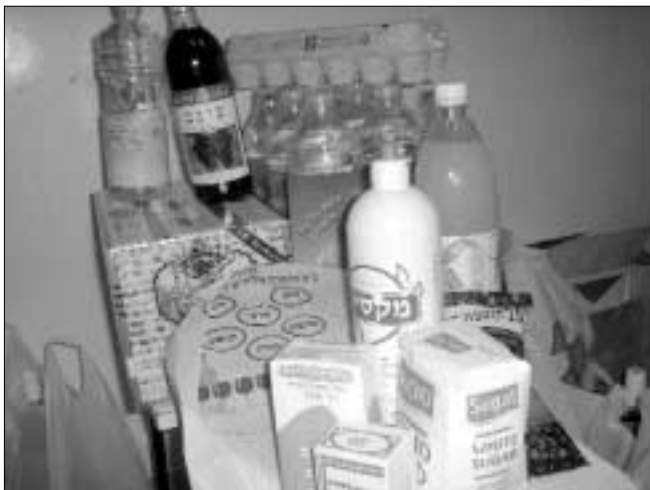
ערכת מזון שחילק בית חב"ד ברמת השרון לכששים משפחות

לקראת חג הפסח החליט בית חב"ד ברמת השרון "לאמץ" 60 משפחות נזקקות כדי לאפשר להן לערוך את החג בצורה מכובדת. ואכן, לקראת החג קיבלו הנזקקים לבית חב"ד מוצרים מכובדת