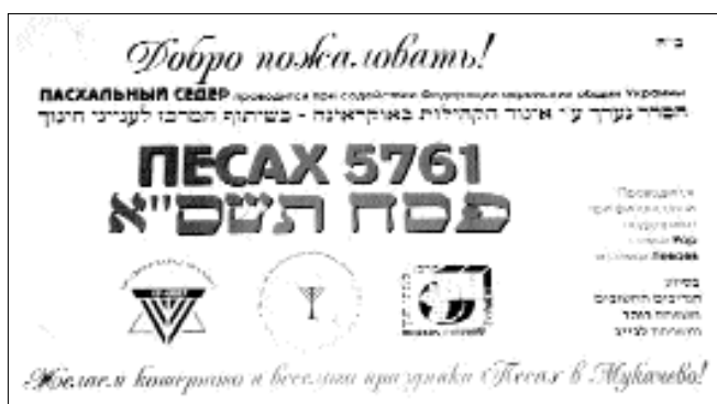
שלט שלווה את כל השלוחים בחבר העמים בחג הפסח

באולינובסק שברוסיה נדהמו התמימים לגלות בין משתתפי ה'סדר' את השוטר שעצר אותם בחשד היותם טרוריסטים צ'צ'נים... ● הרב הראשי נאלץ להתנצל על מחסור במצות למרות שחולקו ונמכרו כשש-מאות טון... ● יועץ נשיא טג'יקסטן התקשר והודה על המצות שהועברו בדרך-לא-דרך למרות הקרבות הקשים המתחוללים באזורם ● השליח שהלך בליל הסדר ברחוב ופגש לפתע בראש העיר הגוי מחזיק בידיו מצות... ● שגריר ישראל בקזחסטן וקירגיזיה לא הסתיר את התרגשותו כל מהלך ה'סדר' ● סקירה על הפעילות הענפה של השלוחים בחבר העמים בחג הפסח ולקראתו