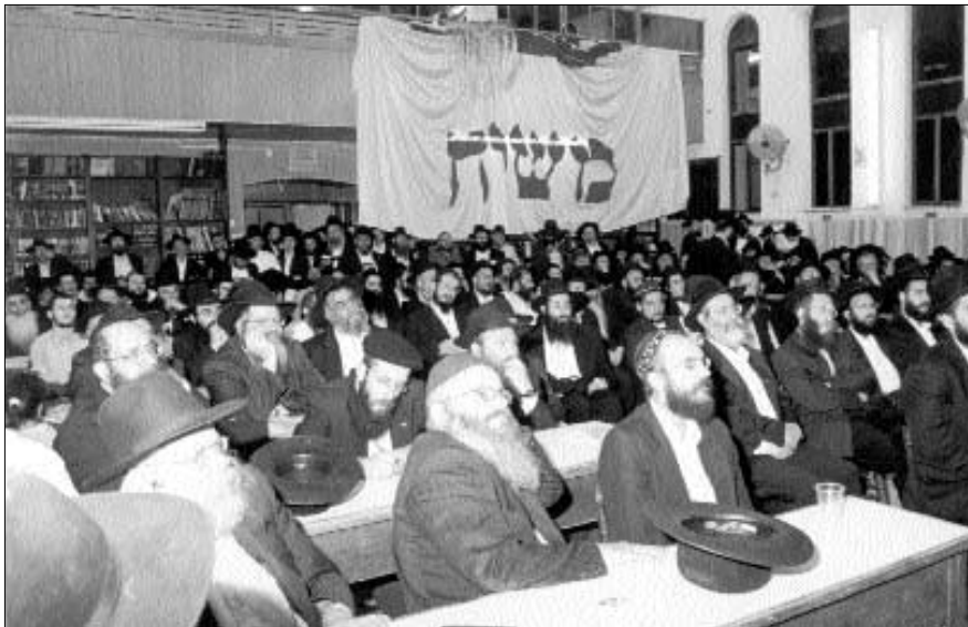
חלק מקהל המשתתפים בכינוס בכפר חב"ד

בהשתתפות רבני בית-דין חב"ד בארה"ק, משפיעים, שלוחים, אנ"ש והתמימים, התקיים כינוס ארצי לרגל מלאת עשור לשיחה הנוקבת-לבבות "עשו כל אשר ביכולתכם להביא להתגלות מלך המשיח בפועל ממש" • במשך שעות ארוכות נשמעו דברי הנואמים והמשפיעים סביב קריאתו הנוקבת לכל חסיד באשר הוא לעשות כל אשר ביכולתו • רשמים מכינוס ספוג אמונה יוקדת