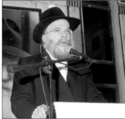
הרב שלום דובער הלוי וולפא: יש למצוא אדם מיוחד שיתעסק בהפעלת אנ"ש בארה"ק ולהביאם למחות בצמתים, שלטים, הפגנות וכדומה. אמנם לא עלינו המלאכה לגמור, אבל לפחות נדע שהבענו מחאה וניסינו להטות את דעת הקהל בארץ