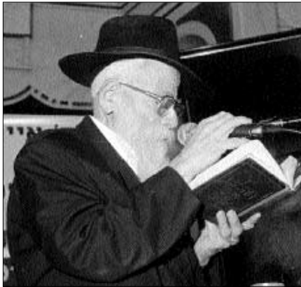
הרב וועלוול קסלמן