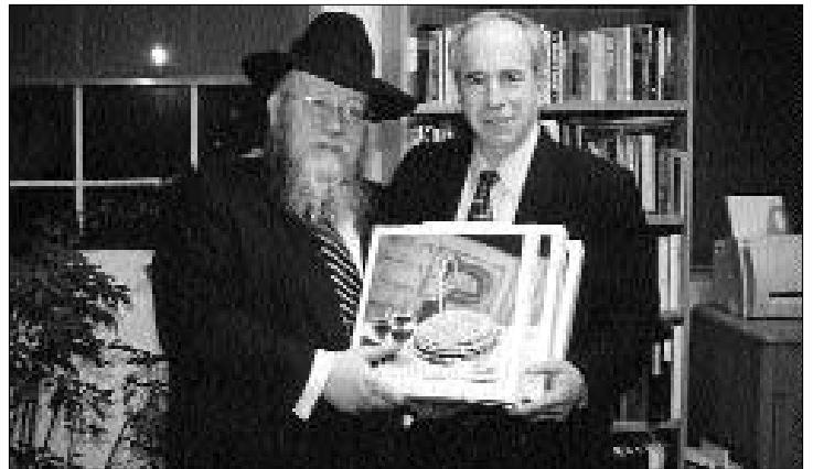
כל ישראל ערבים זה לזה