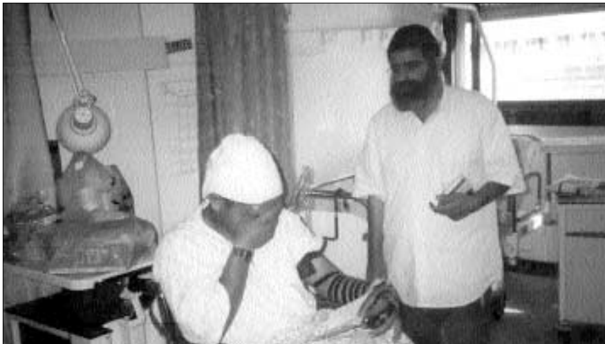
ביקור חולים אצל אחד מפצועי הפיגוע

נפגע הלים ממקורבי בית חב"ד בכפר סבא: "התפילין והחת"ת שהיו עמי ברכב הצילו אותי". בוגר בית-ספר חב"ד שנפצע בדרגה בינונית אומר בהתרגשות: "רסיסים רבים פגעו בתיק שהיה על גבי". מנהלי בתי חב"ד מספרים על שרשרת של ניסים