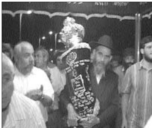
ספר התורה לעילוי נשמת חללי אסון המסוקים

במקום נבנה כעין עץ, בעל שבעים ושלושה עלים, כשעל כל עץ הונצח שמו של אחד הנופלים.