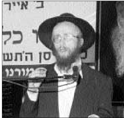
הרב זלמן נוטיק