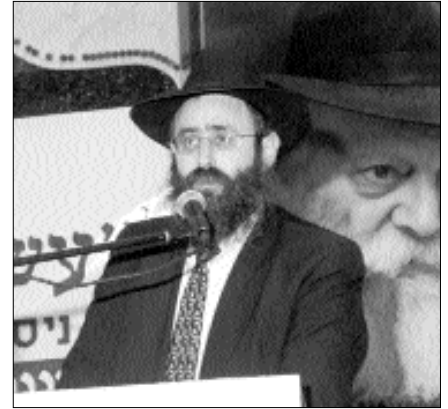
הרב מנחם מענדל גלוקובסקי: יום כ"ח ניסן הוא היום הגדול בחייו של חסיד, ביום זה קיבלנו כוחות מיוחדים שלא ניתנו לנו עד כה, כדי לבצע את המשימה הגדולה של הבאת המשיח כפי שפורטה באריכות באחד-עשר החודשים שלאחר מכן."