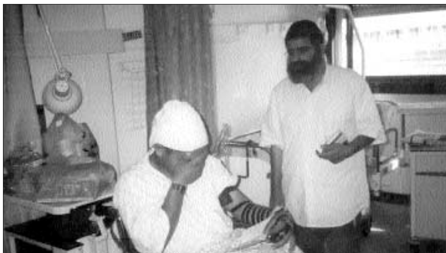
ביקור חולים אצל אחד מפצועי הפיגוע

נפגע הלים ממקורבי בית חב"ד בכפר סבא: "התפילין והחת"ת שהיו עמי ברכב הצילו אותי". בוגר בית-ספר חב"ד שנפצע בדרגה בינונית אומר בהתרגשות: "רסיסים רבים פגעו בתיק שהיה על גבי". מנהלי בתי חב"ד מספרים על שרשרת של ניסים