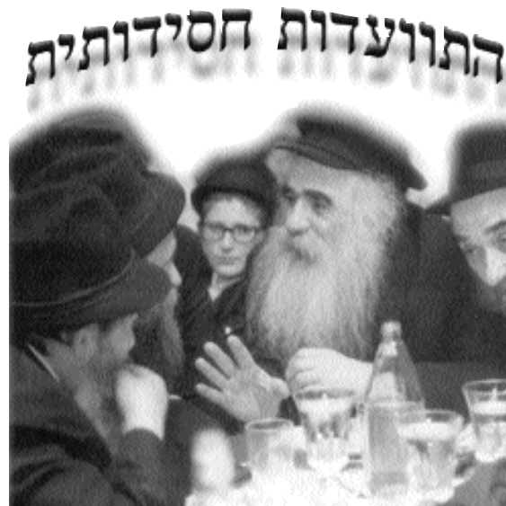
עם הרב לוי-יצחק גינזבורג

בתוך כך נפתחה הדלת, ותלמיד נוסף מתלמידי השיעורים התגנב לאולם. אחד ממשגיחי הישיבה שיחיו הבחין בכך, וכיוון שכולם ידעו את פקודתו הנמרצה של הרבי שליט"א, התובע תמיד שבישיבה בפרט ואצל חסידים בכלל יהיה הכל בסדר מסודר,