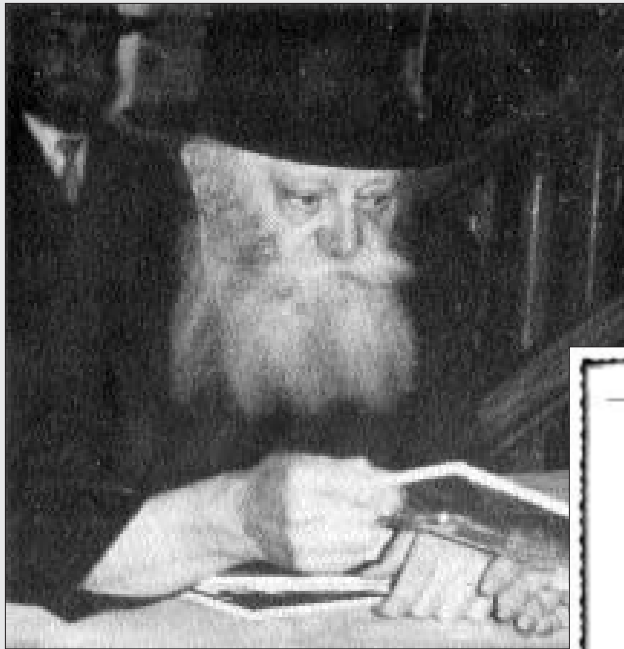
למעלה: כ"ק אדמו"ר שליט"א בעת חלוקת 'קובץ כ"ח סיון יובל שנים', שנת תנש"א מימין: שער הקובץ