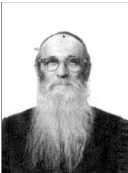
הרב ישראל ג'יקובסון

מסמכים המעידים עליהם. התמימים הבינו כי אין זה אלא עלילה כדי להפילם בפח יוקשים ולאצם להודות כי אינם אלא תלמידי ישיבה. הפחד היה נורא. לבסוף נחלצו אנשי הקהילה היהודית בנעוול שיצרו קשר עם התובע הכללי של העיר, וזה האחרון הורה לשחררם בתנאי שיעזבו מיידית את העיר.