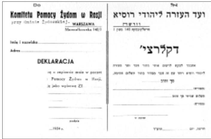
צילום כרטיס חבר הוועד

ואין אני מתחשב ב"מה יאמרו הבריות" וב"למה יאמרו הגויים". כשעושים באמת מכל הלב אזי שום דבר אינו יכול להזיק. אין להתפעל ממשלות של מאה אלף זלוטס [שם המטבעות בפולין]. אלא שיהיה "כל ישראל" ב"יתחן ישראל נגד ההר" כשיש "הר" צריך להיות "יתחן כל ישראל". ברצוני להגיע אל הלב היהודי ואז כל הלבושים המפלתיים לא יסתירו. כסף נהיה מוטע של זלוטע או של חצי זלוטע אלא כל אחד צריך לדעת שיש אצלו "כרטיסי בית החיים"