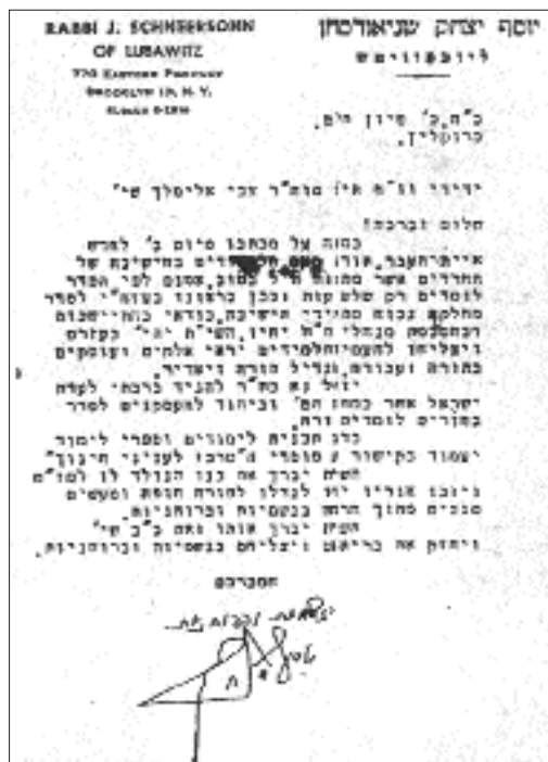
מכתב כ"ק אדמו"ר מהו"ר"צ אל האדמו"ר מלוקווע