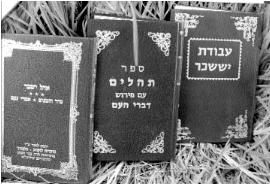
ספרי חצר לוקווע וולברוז' שהודפסו על פי הוראתו של הרבי

עסק רבות בענייני גאולה ומשיח ועמד על הצורך להחדיר את הנושא בכל החוגים. תדיר נהג לומר כי היום נוכחים לדעת כי התגלות המשיח אינה "לוקסוס", אלא היא כורח השעה, כאשר אין שום פתרון באופן, רק התגלות מלך המשיח תיכף ומיד ממש