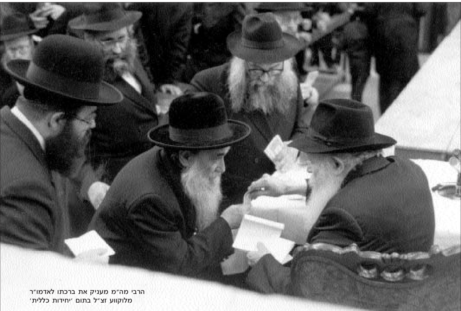
הרבי מה"מ מעניק את ברכתו לאדמו"ר מלוקווע זצ"ל בתום "חידות כללית"