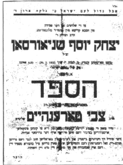
מודעה הקוראת לציבור להגיע להספד של האדמו"ר מלוקווע על כ"ק אדמו"ר הריי"צ

הברכות של הרבי, מיותר לציין, התקיימו במלואן. שניים מבניו מכהנים כשלושים