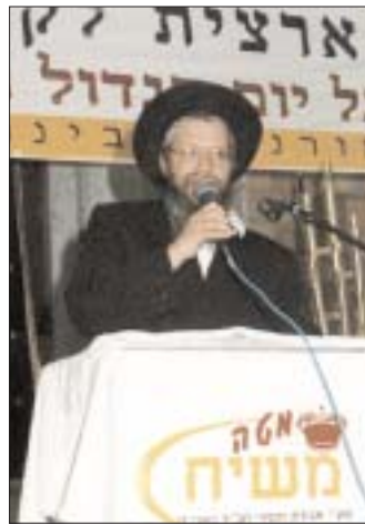
הרב אברהם שמואל בוקיעט