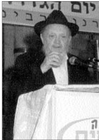
הרב יצחק גינזבורג