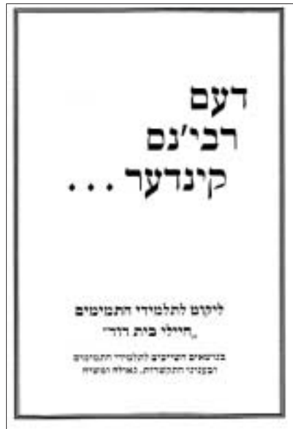
שער הספר החדש

הספר יצא-לאור ע"י 'איגוד התמימים' בשיבת "אהלי-תורה", ונערך ע"י הרה"ת בן-ציון ראובן פיפ והרה"ת שלום היידינגספלד. בסוף הספר ליקטו העורכים מקבץ גדול ומעניין של מכתבים אודות אירגון 'איגוד תלמידי הישיבות' שהוקם ע"י כ"ק אדמו"ר מהוריי"ץ והורחב וחזק ע"י הרבי שליט"א. אין ספק שספר זה יוסיף נדבך חשוב בחיזוק ההתקשרות לנשיאנו ובפרט בימי סגולה אלו אשר בהם מתחזקת הנבואה ש"נהנה זה" הרבי שליט"א בא וגואל אותנו גאולת עולמים.