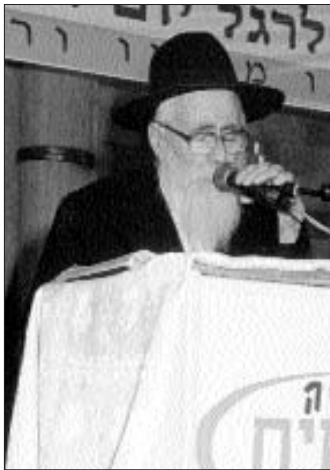
הרב וועלוול קסלמן