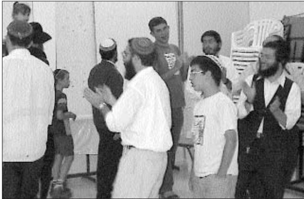
ריקודים חסידיים בכרמי צור