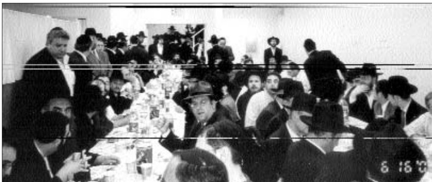
חלק מהקהל בהתוועדות ההכנה לג' תמוז

לפני ג' תמוז, ערכה הישיבה התוועדות מפוארת בה נטלו חלק תלמידי הישיבה, ועוד כשלוש מאות אורחים שבאו לשמוע את