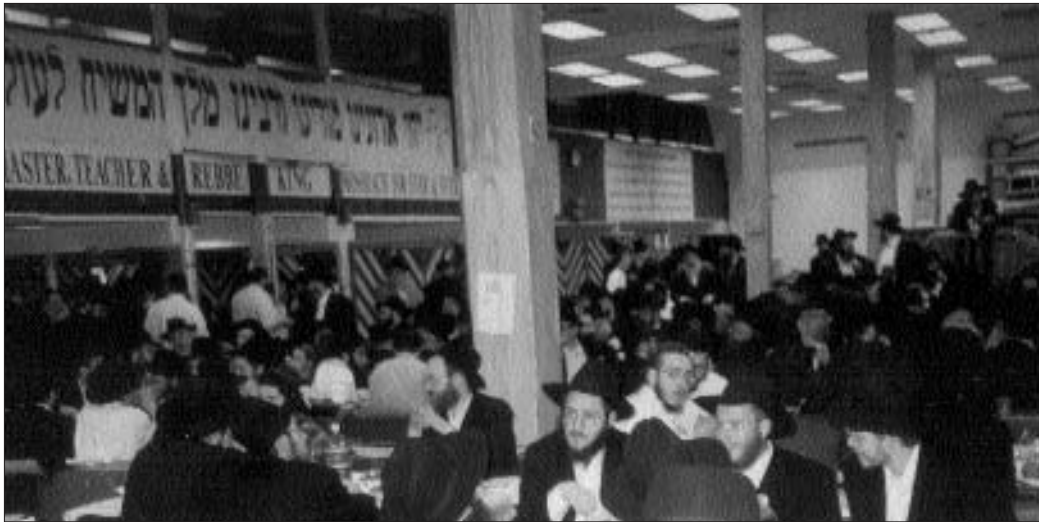
חלק מקהל המתוועדים בי"ב תמוז