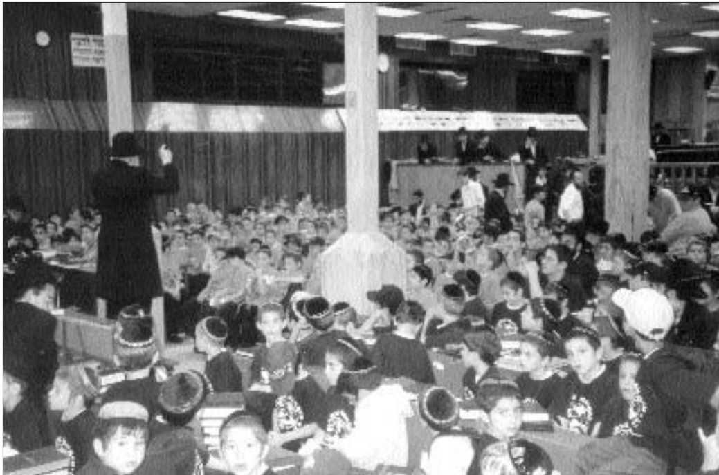
מאות ילדים ב'ראלי' לכבוד חג הגאולה י"ב-י"ג תמוז