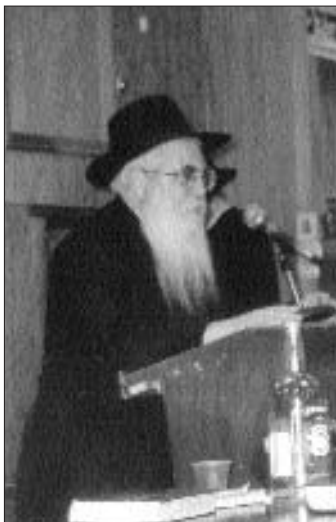
הרב שלמה מאיעסקי