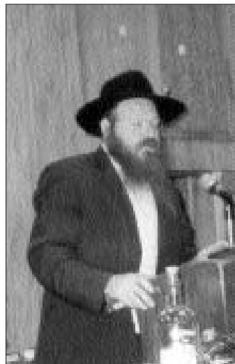
הרב ישראל שכנא דוברוסקין