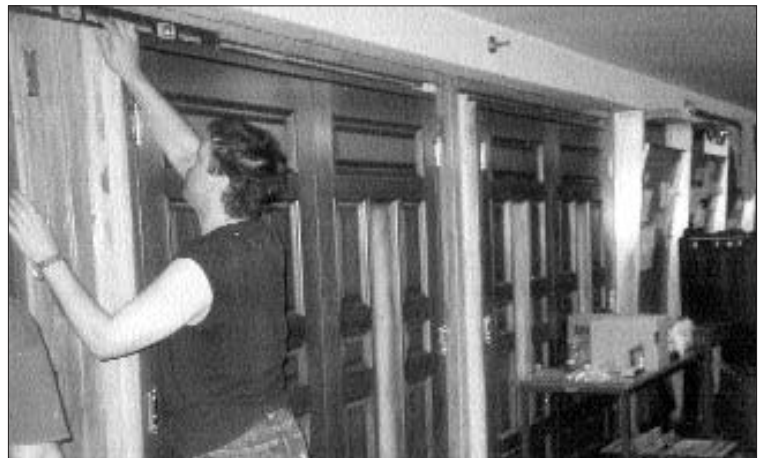
מחליפים דלתות ב"בית רבינו שבבבל"

ידועה המחלוקת בין הפוסקים השונים מי יבנה את בית המקדש השלישי? דעה אחת סוברת כי בית המקדש השלישי ירד בנוי ומשוכלל מן השמים, בלא מגע יד אדם; ואילו הדעה השניה גורסת כי כשם שבתי המקדש הראשונים נבנו בידי אדם ולא ירדו מוכנים מהשמים, גם בית המקדש השלישי יבנה בידי אדם. בשיחות הקודש