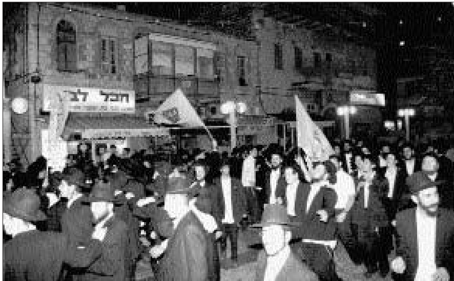
המונים רוקדים במעמד קידוש הלבנה

מאות מתושבי צפת השתתפו במוצאי שבת פרשת חקת במעמד קידוש לבנה המוני שהתקיים במרכז המדרחוב בעיר. מעמד זה נערך מידי חודש בעקבות הוראתו המיוחדת של כ"ק אדמו"ר מלך המשיח, שזוהי סגולה מיוחדת לקירוב וזירוז הגאולה. המעמד אורגן על ידי "מטה משיח" שעל-ידי תלמידי ישיבת חסידי חב"ד ליובאוויטש בעיר.