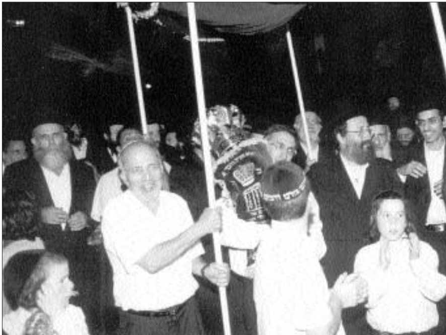
ספר התורה שנתרם על ידי משפחת דחוח מובל תחת חופת אפריון