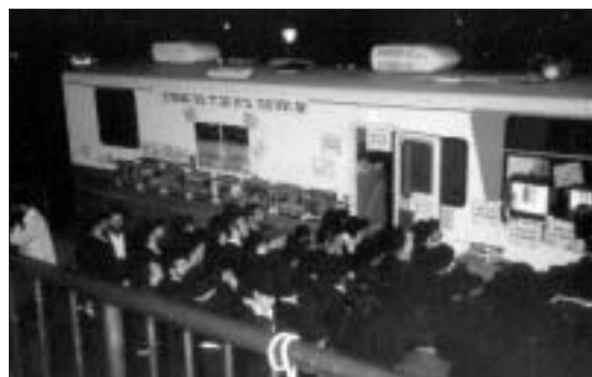
אנ"ש והתמימים ליד ניידת ההתרמה מול 770

ימי ההתרמה נועדו בעיקר, לתושבי השכונה, אך בהחלט לא רק. הפירסומים על דבר האפשרויות העומדות לרשות התורמים מתפרסמים בשבועון זה. יחד עם קריאה מלב אל לב של בית חב"ד לאלו מאנ"ש שלא ידעו מימי ההתרמה, או שלא הספיקו, אלו כמו אלו, יכולים עדיין – כמובן – לשלוח את תרומותיהם לפי הכתובות המתפרסמות במודעה מטעם בית חב"ד לב השמרון.