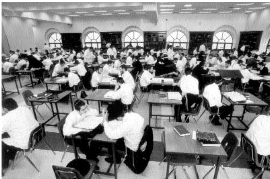
מאות תלמידי הישיבה לומדים בזאל החדש

הדינר השנתי לטובת מוסדות חינוך על טהרת הקודש "אהלי מנחם – אהלי תורה", התקיים השנה ביחד עם חנוכת הזאל החדש של בית המדרש.