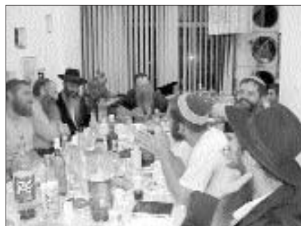
תושבי נווה צוף בהתוועדות לכבוד חג הגאולה