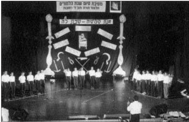
מקהלת הת"ת בשירתם לפני ציבור ההורים והאורחים ברחובות