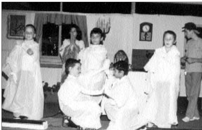
תלמידי "אור שמחה" בהצגה לפני משתתפי חגיגת הסיום

במהלך הערב הציגו התלמידים משחק הצגה מרהיב בנושא שיבתו של יהודי למקורות.