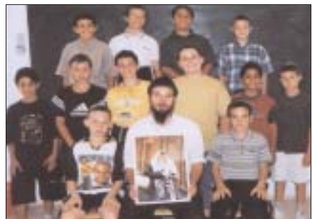
המצטיינים בבית-הספר חב"ד באילת

במהלך הערב ניכרת היתה ההתרגשות של ההורים לנוכח ההישגים וההתקדמות של בניהם בכל התחומים. בסיום הערב הביעו את הערכתם לצוות החינוכי והפדגוגי, ובראשם למנהלת התלמוד תורה הרבנית הכט.