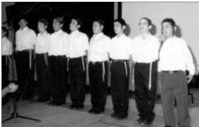
מקהלת כתה ח' בתלמוד תורה בחיפה והקריות בשיר "עולם חדש" על עידן הגאולה

לאחר מכן הופיעה מקהלת התלמוד תורה בשיר חדש בשם "עולם חדש", אשר מילות השיר מתארות את עידן הגאולה העומדת על הסף. ועל גבי המסכים הוקרנה מצגת הממחישה את פעילות התלמידים בוועדות