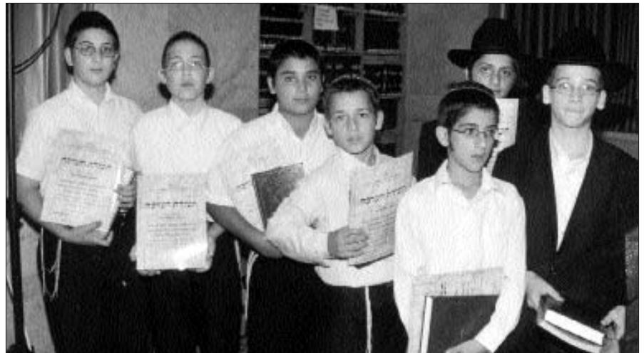
פרסים ותעודות הוקרה למצטיינים