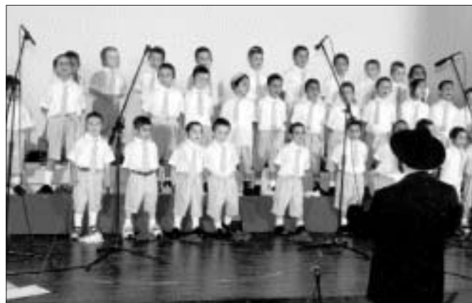
תלמידי התלמוד תורה בראשון לציון בהופעתם