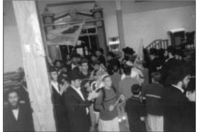
קבוצת נערים ממדינת דרום קארולינה בריקוד "יחי" לאחר התפילה