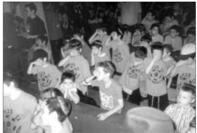
מאות ילדי הקמפיים מתאחדים עם כינוס הילדים בירושלים

דלעתיד, במהלכו שוב אמרו הילדים את שתיים עשרה הפסוקים תוך שהם מתאחדים עם ילדי ארץ הקודש. בסיום הכינוס ריחפה התחושה בקהל כי שוועתם של תנוקות של בית רבן עלתה השמימה וכי א-ל כביר לא ימאס בהבל פיותיהם שאין בו חטא, ותכף ומיד נזכה לפקוח את העיניים ולהכנס לגאולה השלימה.