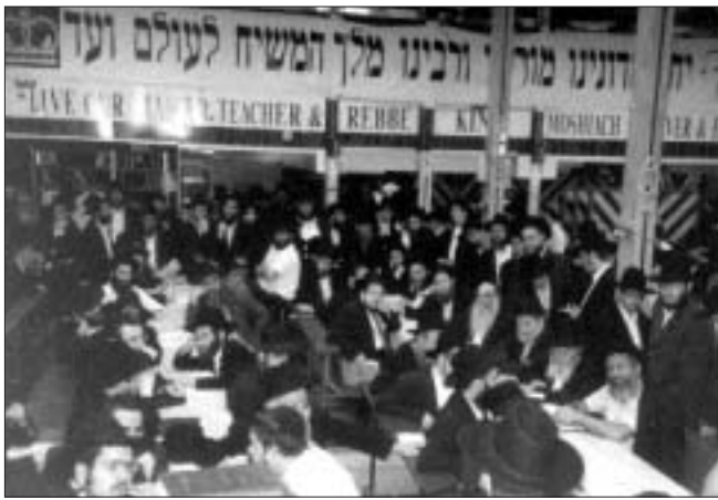
חלק מהקהל בעת עריכת הסיומים