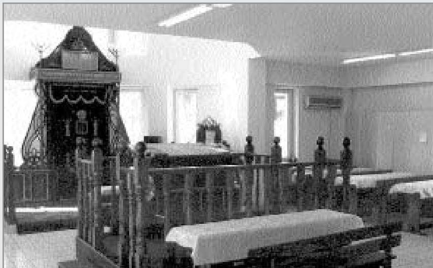
מראה בית הכנסת הגדול באלמא-אטא

"תקופה קצרה אחר-כך הייתי בביקור בארץ. התקשרתי לרב יהודה קובלקין שמילא את מקומי בבית חב"ד, כדי לבשר לו שהצלחתי לגייס קצת כסף לפעילות. בתגובה הוא סיפר לי שבבוקר הגיע לבית הכנסת אדם לא מוכר (מאוחר יותר התברר שזה אותו אלמוני שתרם חמישים אלף דולר), ואחרי התפילה ניגש לקופת הצדקה והכניס לתוכה