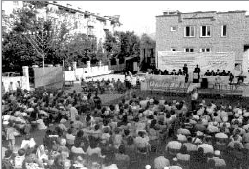
מאות יהודים בכינוס מול בית הכנסת