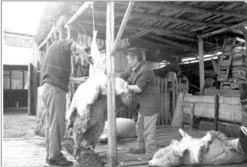
בשר כשר במדינת קזחסטאן

מיד לאחר שחזרנו מהביקור אצל הרבי, קיבלנו מהעירייה כמה הצעות. אחד המקומות שהוצעו, היה סמוך מאוד לציון של רבי לוי יצחק. היה זה נס בתוך נס, כיוון שאנחנו ביקשנו שטח של אלף מ"ר, והשטח שליד הציון היה של 3,500 מ"ר!