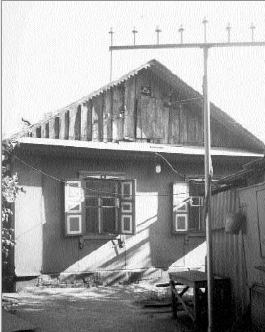
בית הכנסת הישן באלמא-אטא