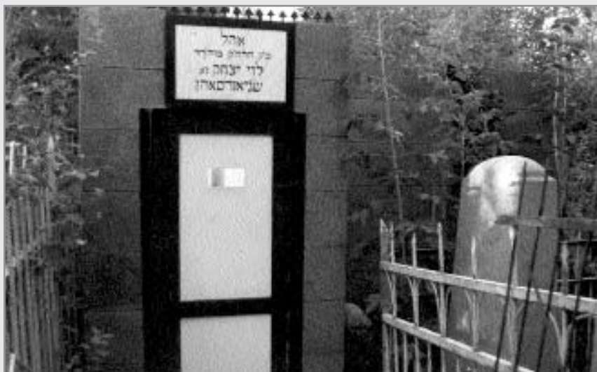
הכניסה לציון רבי לוי יצחק