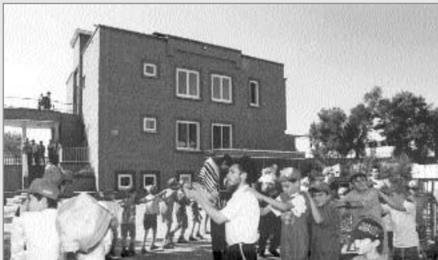
שמחה יהודית מופגנת באלמא-אטא