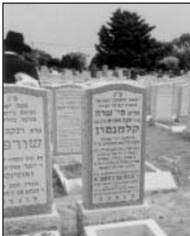
הייתה קשורה בכל נימי נפשה לכ"ק אדמו"ר מלך המשיח. והייתה משתדלת

בשנים האחרונות חלתה וקבלה את יסוריה באהבה. כאמור בז' מנחם אב השיבה את נשמתה ליוצרה והובה למנוחות בערב שבת קודש אחר חצות. השאירה אחרי' את בעלה יבלחטי"א, ומשפחה מפוארת בנים ובני בני עוסקים בתורה ובמצוות ומשמשים כשלוחי הרבי. ת.ג.צ.ב.ה.