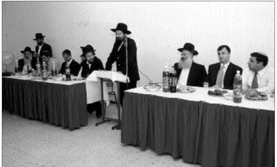
מסיבת סיום בישיבת "אור אבנר" חב"ד בקריית מלאכי

כבכל שנה גם השנה נערך קעמפ, לתלמידי הישיבה. כך למשל בסיום חופשת