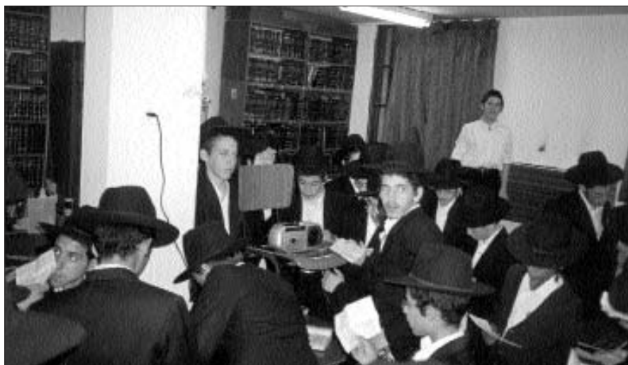
תלמידי ישיבת "בית הר"מ" בקרית מלאכי מאזינים לשיחה מוקלטת של הרבי מה"מ

הקטנות המעולות. הדבר ניכר היטב בשורה של יוזמות חסידיות שיוזמים הבחורים, דבר שמוסיף נופך מיוחד לאוירה המיוחדת של הישיבה. בין היוזמות הייחודיות של תלמידי הישיבה, הוא "סדר רמב"ם", כאשר מידי בוקר מתקיים בישיבה סדר מיוחד ובו לומדים את ג' פרקי הרמב"ם היומיים. על הלוח המרכזי של הישיבה מופיעים בכל שבוע מדורים מגוונים ומעניינים בתורתו של הרבי ובדברי ימי חב"ד, מנהגי חב"ד, גאולה ומשיח, היום יום, פתגם השבוע ועוד. בכך התמימים 'חיים' את הרבי מה"מ כל העת.