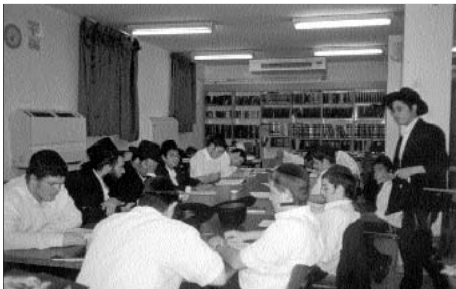
תלמידי ישיבת "בית הר"מ" בעת למודם