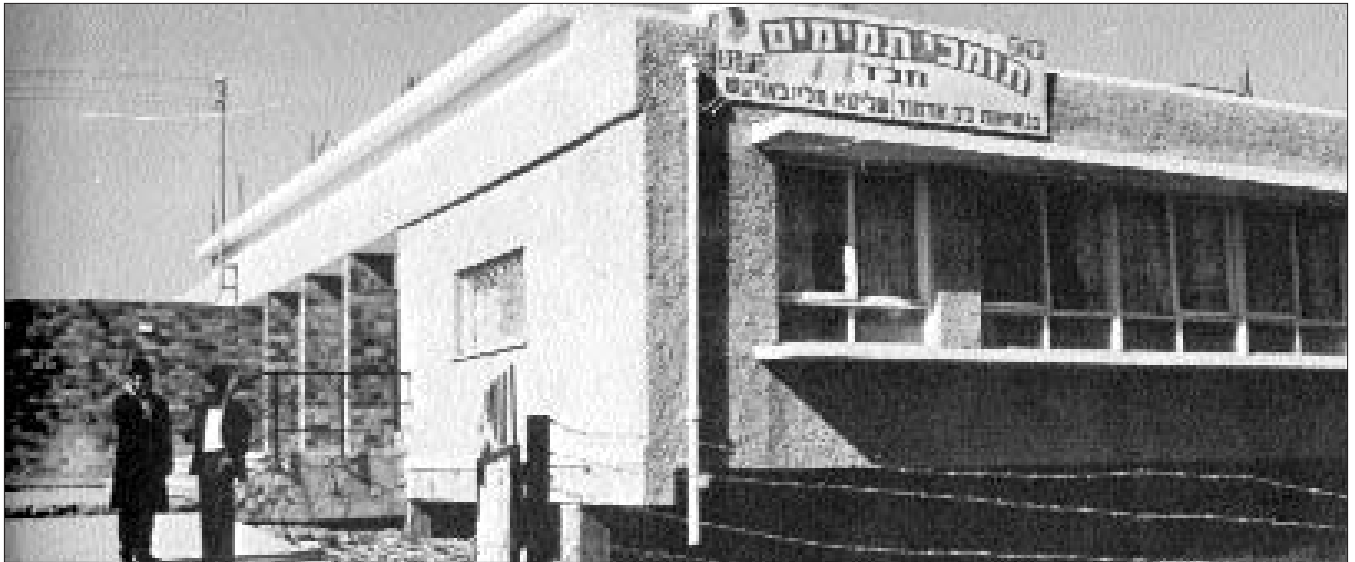
ישיבת "תומכי תמימים" בקרית גת לפני שלושים שנה...

חסידות, התוועדות של משפיעים, ניגונים, ועוד רבות. ספריית הקלטות נחשבת לגדולה ביותר בכמות הקלטות החסידיות. רבים מתושבי העיר, בהם גם תושבי הקריה החרדית, משאילים קלטות וזוכים לטעום מאורה של תורה.