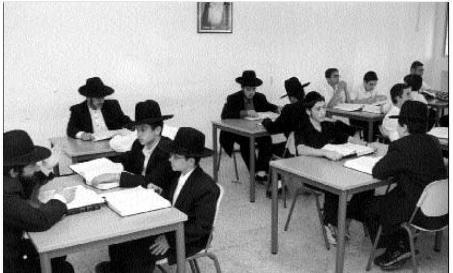
תלמידי "אור אבנר" חב"ד בעת הלימודים

הפעילות עם העדה המשיך הרבי מה"מ, אבל משום מה בשנים האחרונות הורגש חיסרון עצום לישיבה שתהיה מיועדת במיוחד עבור בני העדה הבוכרית. לאחר שנות ה-לי אכן הוקמה ישיבה ייחודית עבור בני העדה, אבל במשך השנים הנושא דעך ובני העדה הבוכרית התפזרו בישיבות השונות.