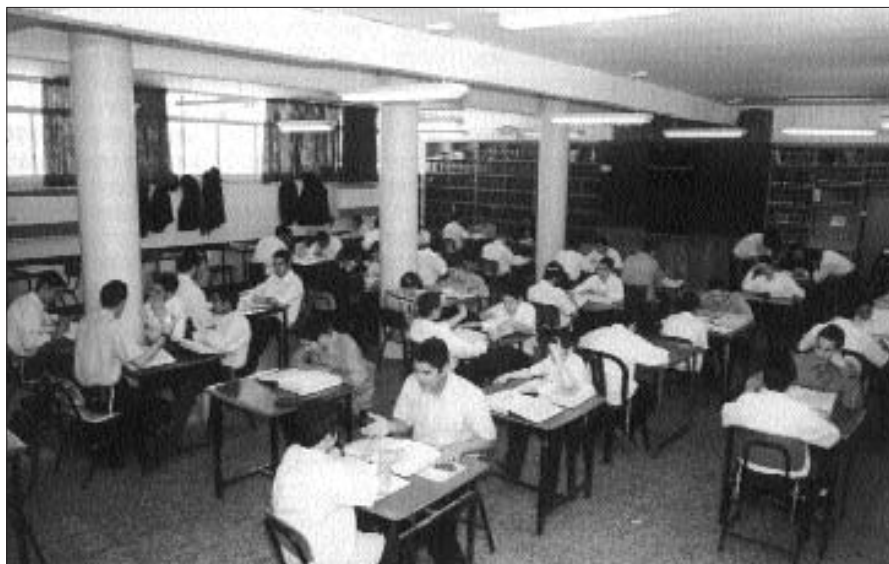
תלמידי "אחי תמימים" בעת לימודם