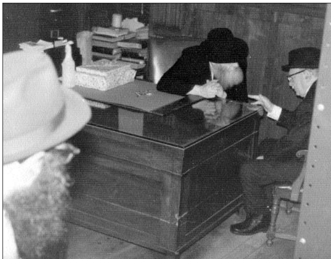
שז"ר ביחידות אצל הרבי, אור לה' שבט תשל"ג

סליחות בשעה 6:45 בבית המדרש החדש. צוה לנגן אבינו מלכנו ג' פעמים. אחרי סליחות נסע למקוה. בשעה 8:50 שאל אם יהי מנין בשעה 9, ויצא אז להתפלל בצבור. אחרי התפלה אמר התרת נדרים בפני עשרה [במקום הנדפס בסידור: לכן אני שואל אמר: לכן שואל אני] בסיום התרת נדרים אמר: "א' יישר כח, א' גוט יאָר, לשנה טובה תכתבו ותחתמו". בשעה 10 לערך התחיל לקבל הפי"נ מכל אחד ואחד, ואמר לכאוו"א: "א' שנה טובה ומתוקה". כשנגמר התור נכנסתי עם הדואר ושאלני אם מכתב הכללי לרי"ה נדפס במכתבי-עת, ובאם במקום הראוי. הראיתי לו המכ"ע ולא הי מרוצה מזה שלא נדפס במקום שכולם ירגישו בו. אח"כ שאל מה נעשה עם פדיון הכללי, אמרתי שהם מוכנים להגישו. אמר אם יכנסו לכאן – לחדר שלו – יהרסו החדר כולו, אמרתי