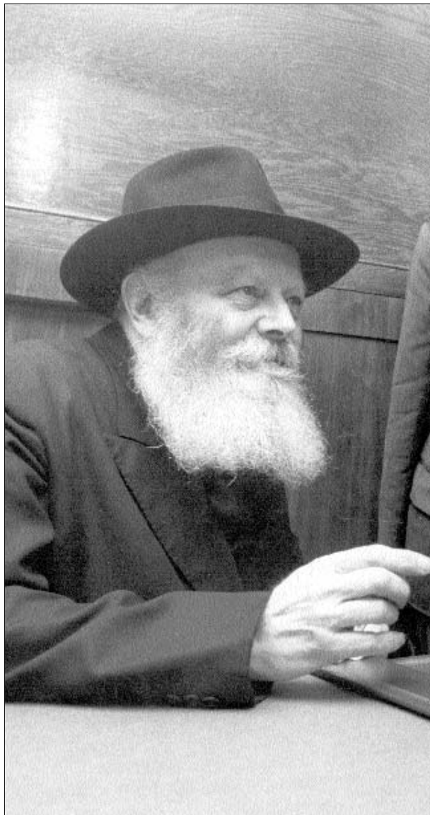
שאלני אם קרה מה שהוא עם פייל [מלך ערב הסעודית], אמרתי כן שנהרג ע"י