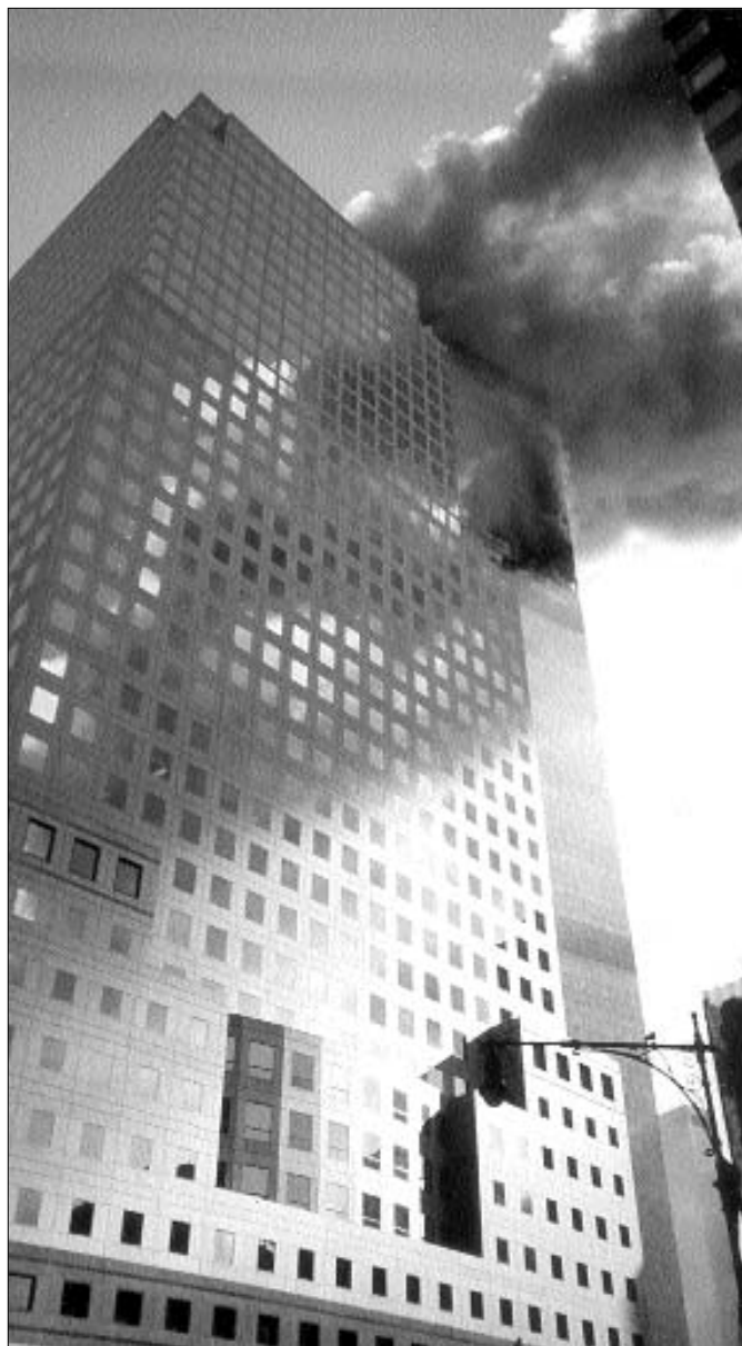
הפיגוע במגדלי התאומים.

בריצה, ומצאתי את רעייתי באיבוד עשתונות כמעט מוחלט. היא נרגעה מעט לאחר ששמעה שבניין המגורים שלנו עומד על תילו, אך שנינו מיהרנו לקחת את הילדים, את הטלית והתפילין ושאר הפצעים הכרחיים, וירדנו לכיוון הרכב החונה ליד הבניין."