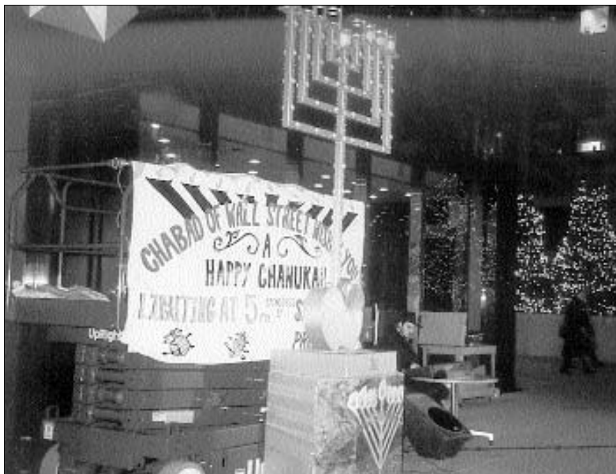
פירסומי ניסא במרכז הסחר העולמי - חנוכה תשס"א

הטלוויזיה בערוץ השביעי של ניו-יורק, ובעיצומה של התפילה הגיעה צוות כתבי הערוץ להתרשם מהזרזות החב"דית. לאחר שהוסבר להם על קדושת היום, הם עזבו את המקום והבטיחו לחזור במוצאי יום כיפור.