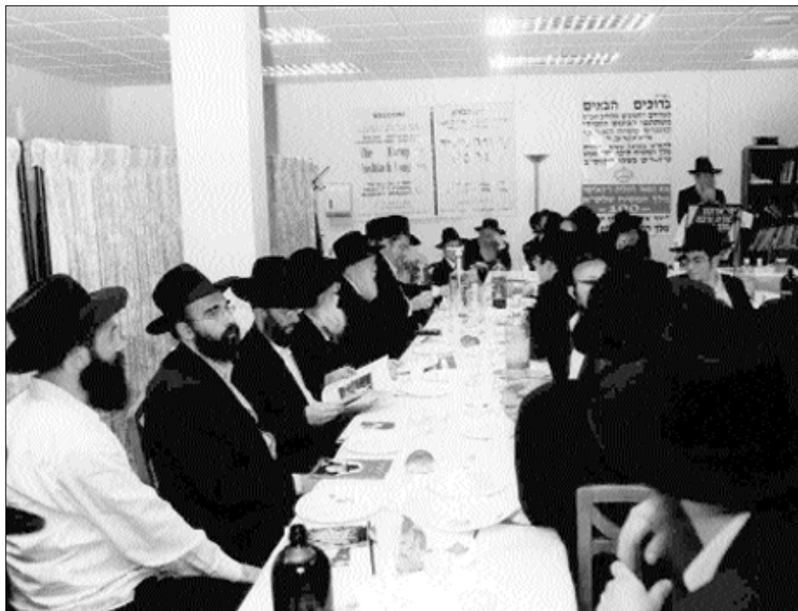
חלק מהקהל בהתוועדות ליל י"ט כסלו