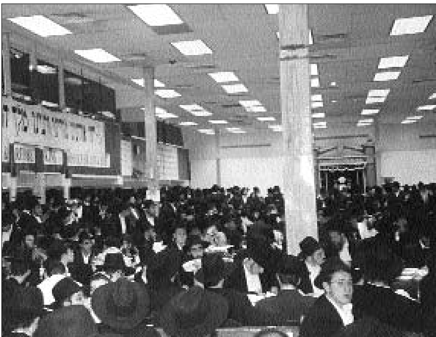
חלק מהקהל בהתוועדות המרכזית של י"ט כסלו ב-770

ההתוועדות המרכזית של חג הגאולה י"ט כסל נערכה ביום שלישי, אור לכ"ף כסלו, בבית המדרש הגדול והקדוש – בית חיינו בית משיח. אלפים של אנ"ש, זקני החסידים, פרחי התמימים, שלוחים ואורחים מהשכונות הסמוכות, ישבו זה לצד זה ליד שולחנות ערוכים לחגוג את חג הגאולה וראש השנה לתורת החסידות במקום שמשם אורה יוצאת לכל העולם.