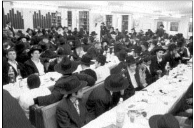
הקהל הגדול מיסב לשולחנות ערוכים