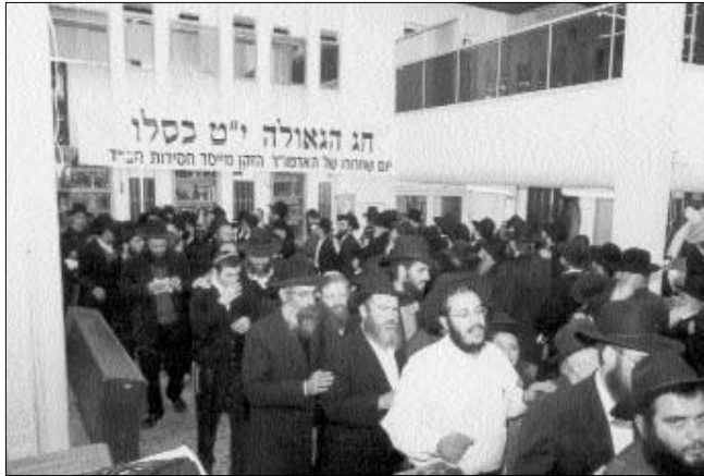
ריקוד חסידי לאחר ההתוועדות