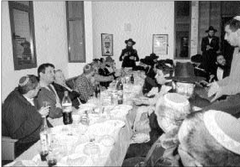
התוועדות י"ט כסלו בראשון לציון

באשדוד, ובית חב"ד אזור י"א באשדוד. פיארו את המעמד רבני העדה הגרוזינית שנטלו חלק בהתוועדות ובירכו את המשתתפים בבארם את גודל מעלת חג הגאולה.