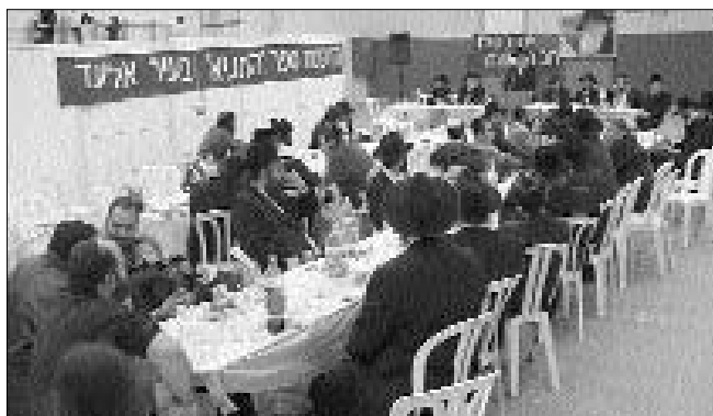
חלק מהקהל בהתוועדות י"ט כסלו באלעד