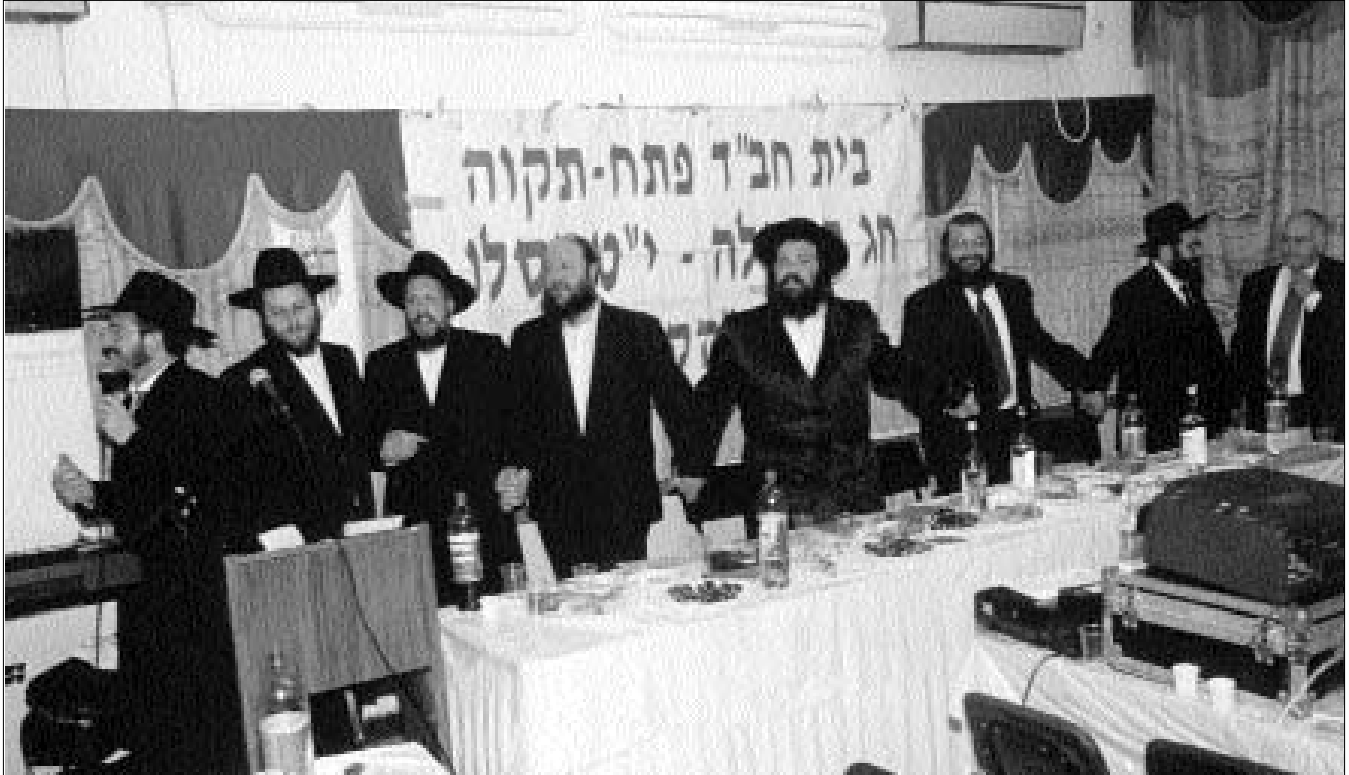
ריקוד חסידי בהתוועדות י"ט כסלו בפתח-תקוה