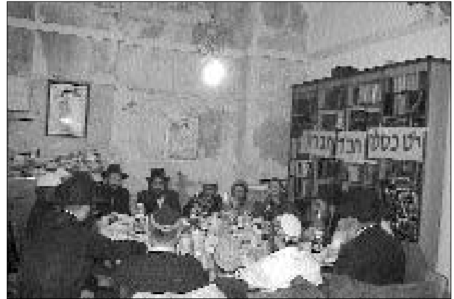
התוועדות י"ט כסלו בחברון

השנה לחסידות. הוא קרא לקהל לקבל החלטה טובה להשתתף בשיעורי חסידות המתקיימים באופקים.