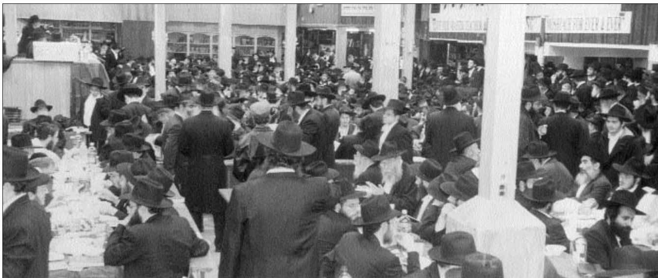
המוני המשתתפים בהתוועדות