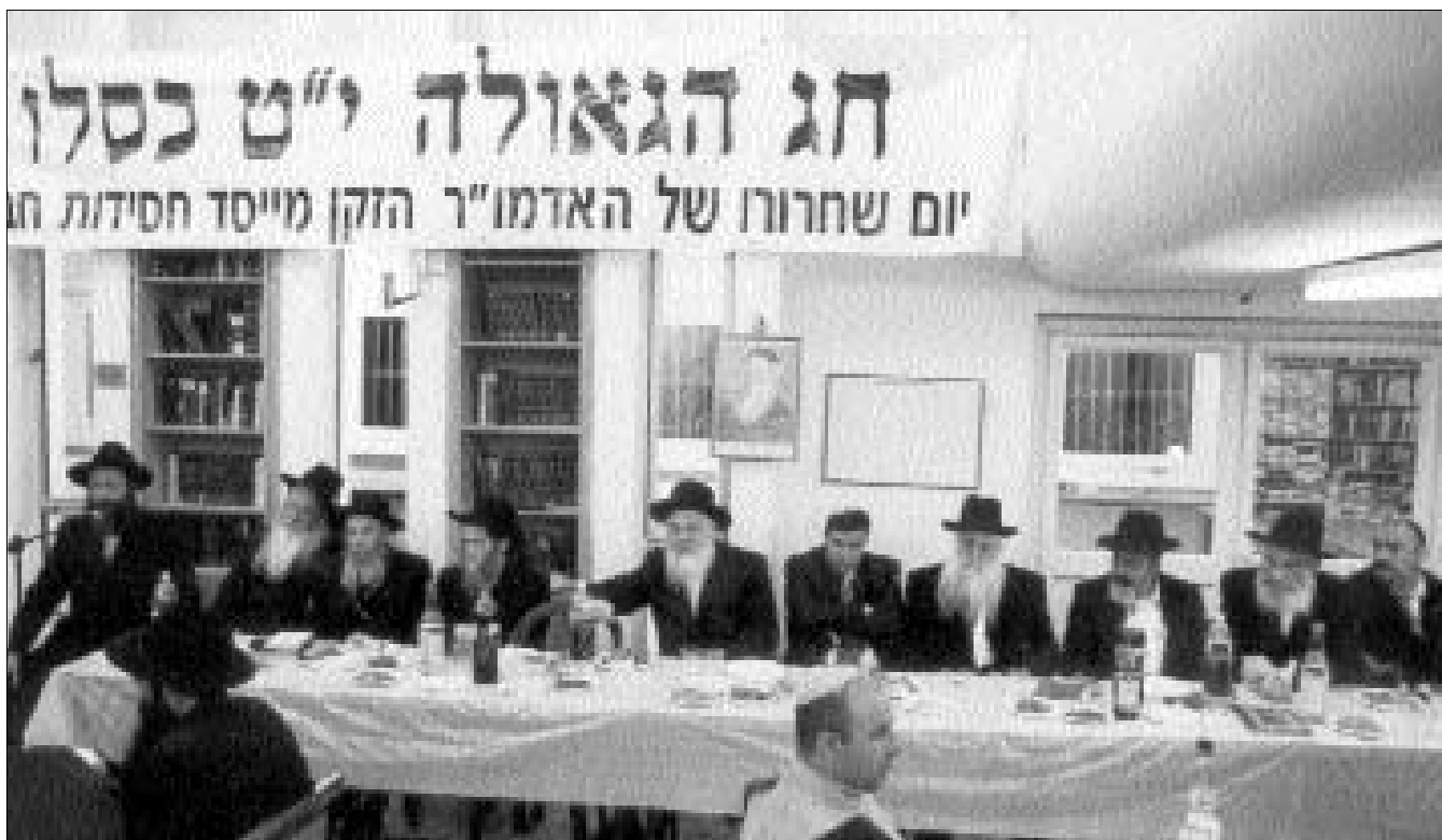
בימת הנשיאות בהתוועדות י"ט כסלו בנחלת הר חב"ד

שזאבי היה מבקש להחריף את עמדת ממשלת ישראל ואת הפעילות נגד הטרור העומד עלינו לכולנו. אבל אנחנו נעמוד איתנים אל מול האויב הפלסטיני – וננצח".