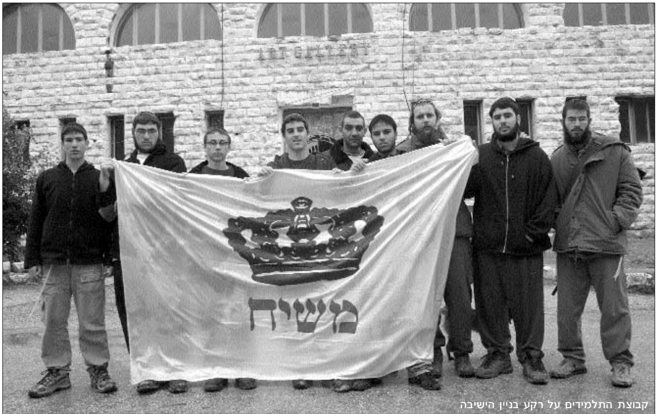
קבוצת התלמידים על רקע בניין הישיבה