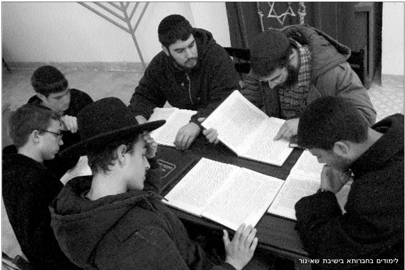
לימודים בחברותא בישיבת שא-נור