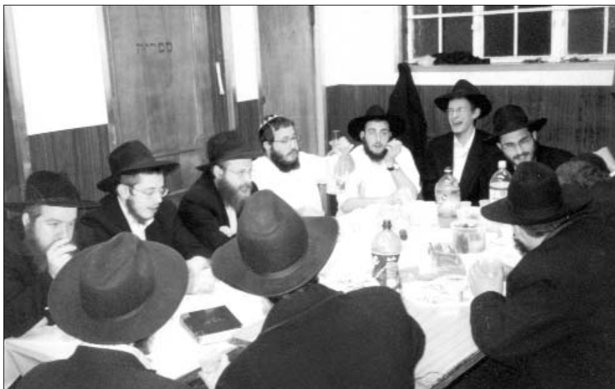
תלמידי התמימים מתוועדים בחדר שני של הזאל הקטן

הראשונה במאמר ד"ה איתא במדרש תילים, ולאחר מכן העלו האחים טעוול זכרונות מאביהם הדגול, תוך שהדגש מושם על 'יהחי יתן אל ליבוי'.