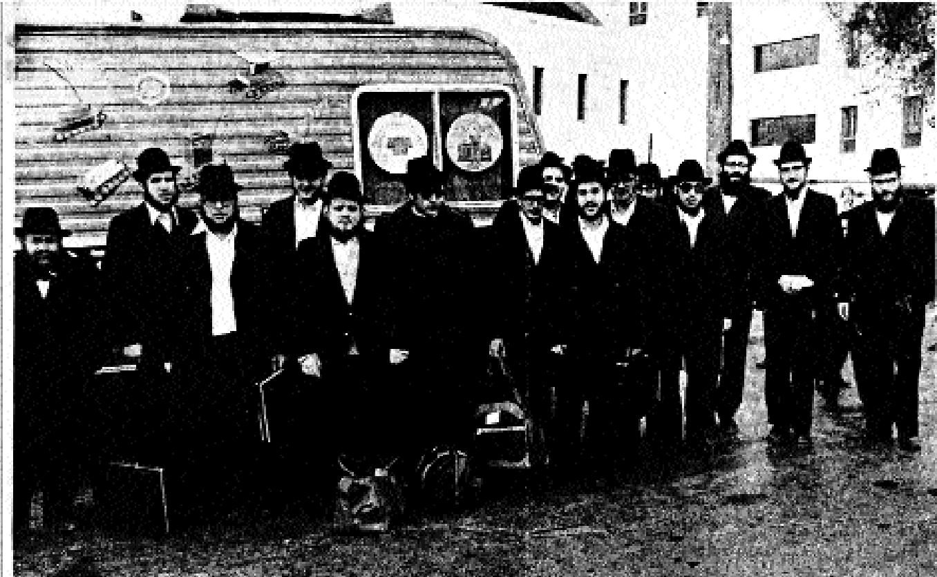
A group of hussidim sent from New York by the Lubavitcher rebbe to settle in Jerusalem, pose on their arrival yesterday in front of the Habad "Mitzva Tank." This is a truck which carries Habad emissaries with ritual articles on their trips throughout the country to persuade Jews to perform the daily mitzvot.