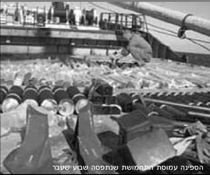
הספינה עמוסת התחמושת שנתפסה שבוע שעבר