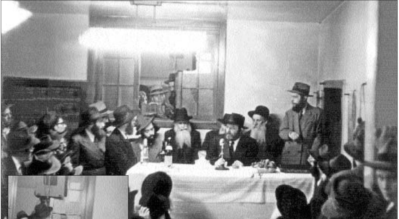
למעלה: הרב מאיר אשכנזי יושב לימין הרבי בהתוועדות כ"ד טבת תשי"ב משמאל: הרב אשכנזי עורך סיום מסכת לפי בקשתו של הרבי