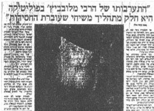
כותרות מן העיתונות לאחר פגישת קצב עם הרבי