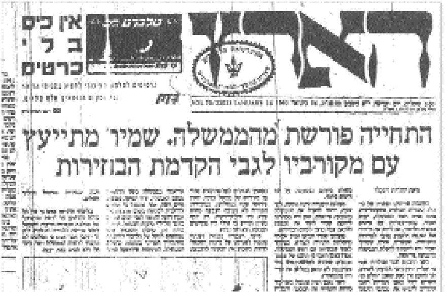
כתורות מן העיתונות לפני פגישת קצב עם הרבי