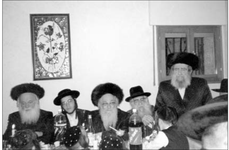
“הפצת המעינות חוצה בכל מקום שידו מגעת”

הרב הרצל מקיים את הוראת הרבי וחוזר שיחות קודש בכל הזדמנות, בפני כל סוגי החסידים והחסידות