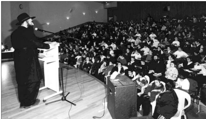
למעלה: מאות ילדי התלמוד תורה משתתפים בכינוס. למטה: הילדים המצטיינים