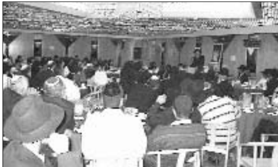
הרב נפתלי רוט מרצה בסעודת מלווה מלכה

התקיים בקרב הנשים דיון פתוח בנושא: "תקשורת בין אם ובתה". בשבת בבוקר הוזמן הרב דוד מפעי לדבר על "צער גידול בנים בתשלומים נוחים", הרצאה שהוקשה בקשב רב. לאחר מנוחת שבת התקיים פאנל מיוחד בראשות הרבנים על מנת להשיב על שאלות בוערות שהועלו ע"י הקהל בנושאי חינוך.