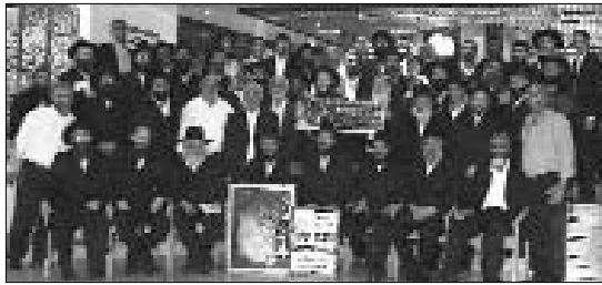
משתתפי השבתון בתמונה קבוצתית