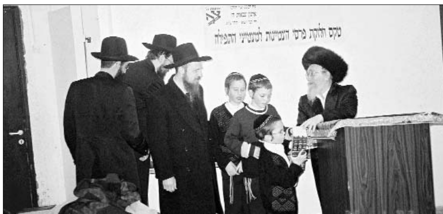
הענקת פרסים לתלמידים המצטיינים

זה שלושה חדשים שילדי ביתר עילית נמצאים במתח של עשייה אם בלימוד ואם בתפילה במסגרת מבצע רחב היקף שמנוהל על ידי ארגון "צבאות ה'" בניצוחם של האברכים הרב שניאור זלמן הניג והרב שמואל לנדאן.