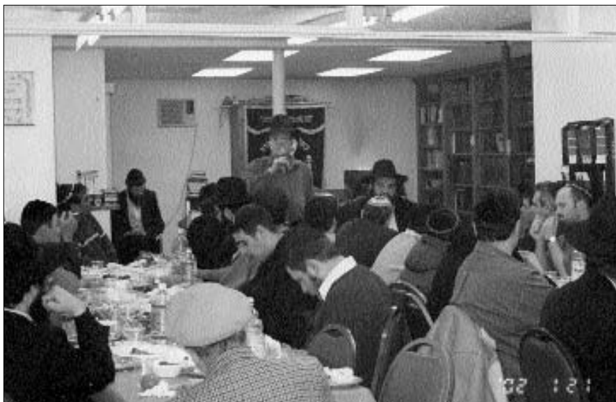
התוועדות יו"ד שבט בפלטבוש