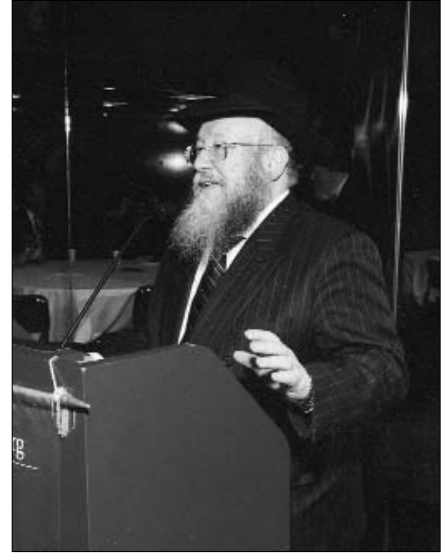
“רואים הערב את פעולותיו של הרבי” הרב שמואל מנחם מענדל בוטמן, מנהל צעירי אגודת חב”ד העולמית