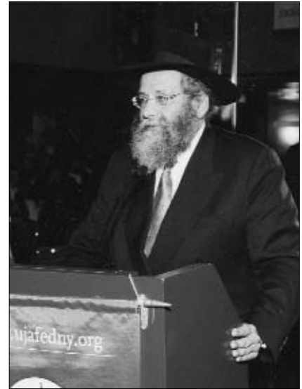
דאגה לכלל ולפרט.