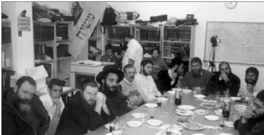
חלק מהקהל בשעת ההתוועדות