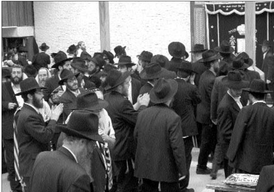
ריקוד "יחי אדוננו" לאחר התפילה במניין כ"ק אדמו"ר מלך המשיח