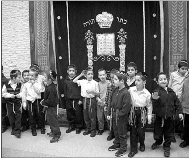
כיתת ילדים מתלמוד תורה "אהלי תורה" בביקור ב-770