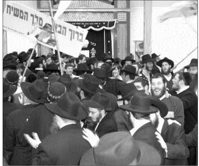
ממראות הריקודים הסוערים בלילות חודש אדר