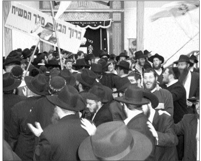
ריקודי שמחה בראש חודש אדר

בתפילת שחרית עוד כמה דברים, שגרמו לשמחה כפשוטה. עליה לתורה של חתן בר מצוה, למשל. ההתוועדות שהתקיימה לאחר התפילה הייתה גדולה ומורחבת מהרגיל, והתנהלה באווירה שמחה במיוחד.