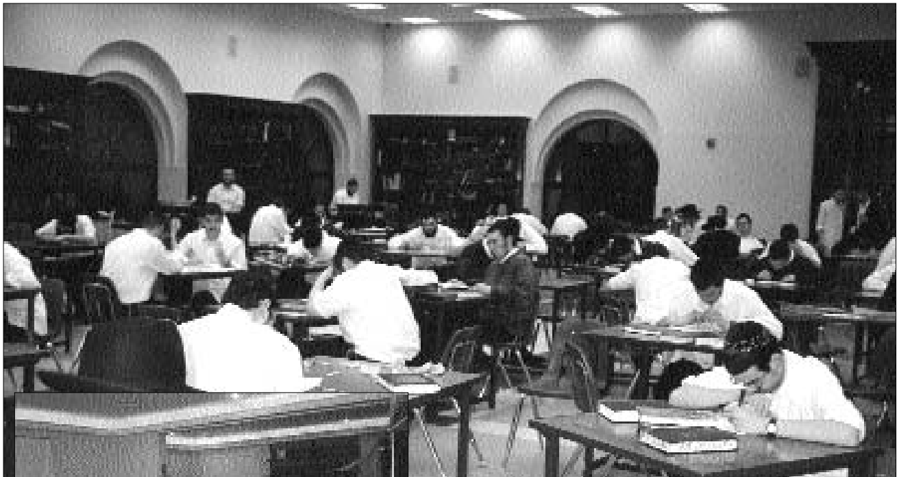
למעלה: הזאל בישיבת "אהלי תורה" בשעת המבחן משמאל: סדר הלימודים בישיבת תות"ל בפאולו ברזיל