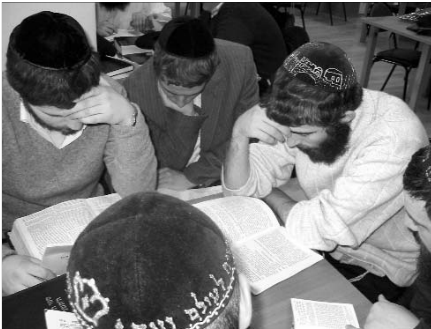
הגאולה מגיעה למוסקבה ופטרבורג...

ביותר בישיבה. הישיבה בנתניה ידועה כמיוחדת בכל הנוגע למבצעים חסידיים של התקשרות, שחלק מהם הפכו אף לאבני יסוד בישיבה בדיוק כמו עצם הלימוד. גם כאן במבצע המיוחד, רואים את התוצאות בפועל ממש. מארגני המבצע בישיבה משוכנעים כי יהיה אפשר לארגן צ'רטר מיוחד רק בשביל המצטיינים... בהצלחה!