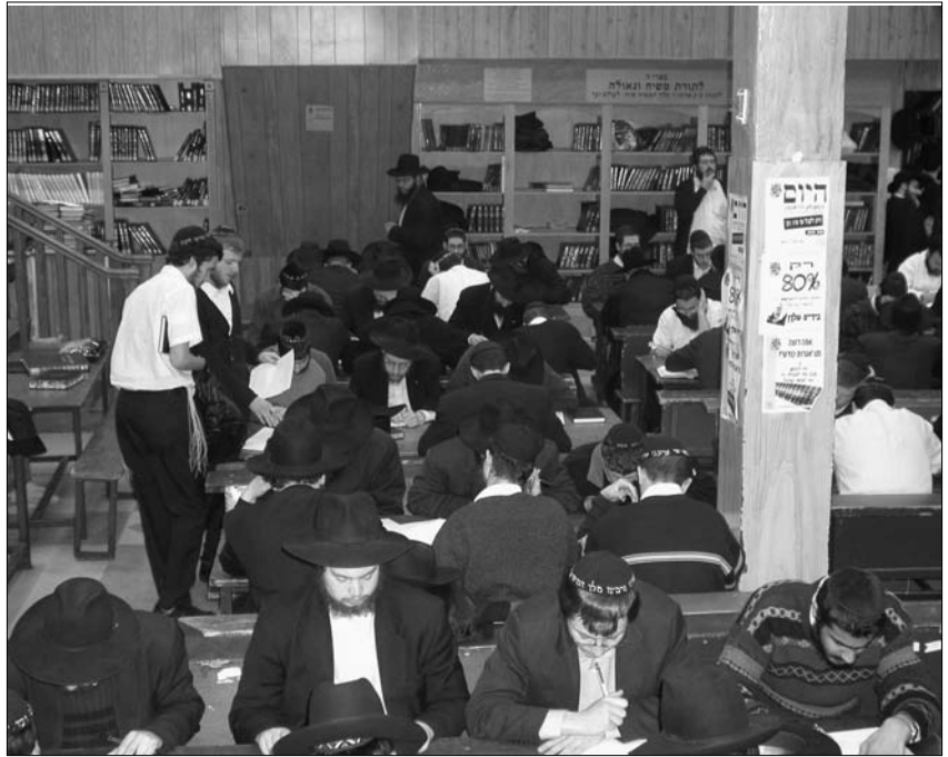
תלמידי התמימים ב"770" בעת המבחן

אצלנו בישיבה, למעלה מ-90% מתלמידי הישיבה משתתפים במבצע. ישנה חיות מיוחדת בלימוד החומר למבצע, כך שגם בסיום סדר הלימוד ניתן לראות בחורים הנשארים ביזאלי לשינון החומר. כשנכנסים לזאל בסדר הזה, מרגישים באוויר חיות מיוחדת.