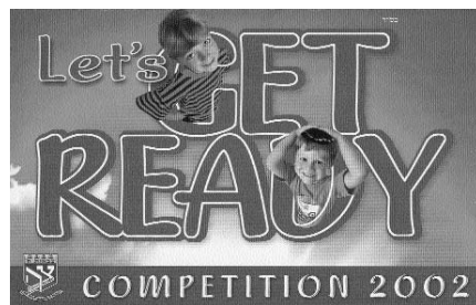
פרספקט מרהיב לילדים – הכנה למשיח

נושאת פרסים חסרת תקדים, בקיום מצוות ומעשי טוב וחסד לזירוז הגאולה. 100,000