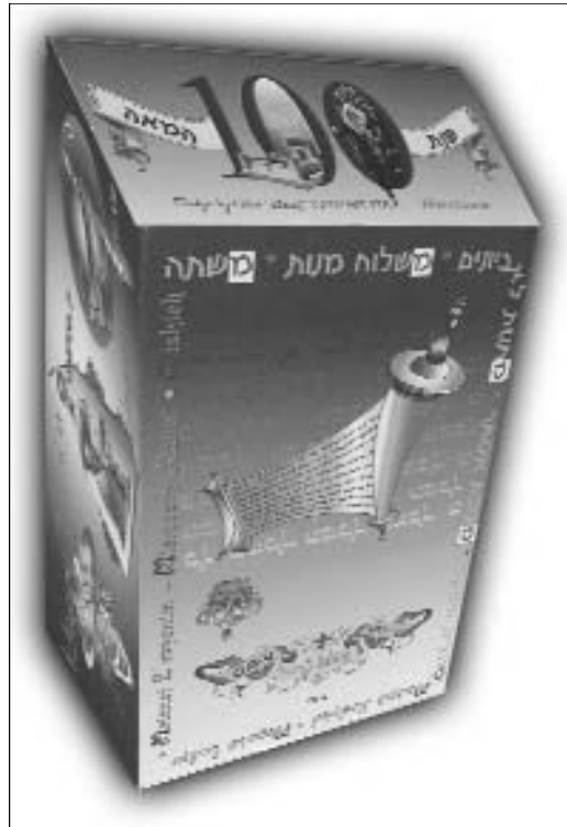
קופסה מיוחדת למשלוח מנות שהונפקה על ידי "מרכז מידע משיח"

בימים אלו נשלמות ההכנות האחרונות של שלוחי הרבי בכל העולם לקראת 'מבצע פורים' שיתנהל השנה ביתר שמחה וחדווה, שהרי השנה היא 'שנת הקהלי', ובמיוחד בשל המצב הביטחוני המעורער, הן בארה"ק והן בכל העולם.