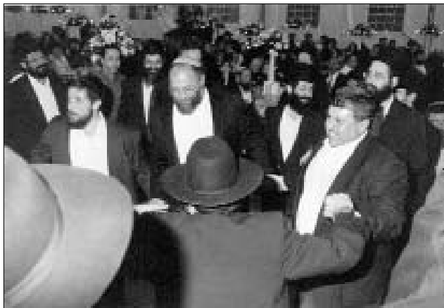
ריקודי שמחה בתום הדינר המפואר

פעילות לקשישים, מרכז פעילות לעולי חבר העמים, כוללי אברכים, מרכז חב"ד לעולי צרפת ולאחרונה גם הקמת המקווה החדש והמפואר בשיטת חב"ד, פתיחת בית התבשיל לנזקקים ובית חב"ד בשכונת המזרח ועוד.