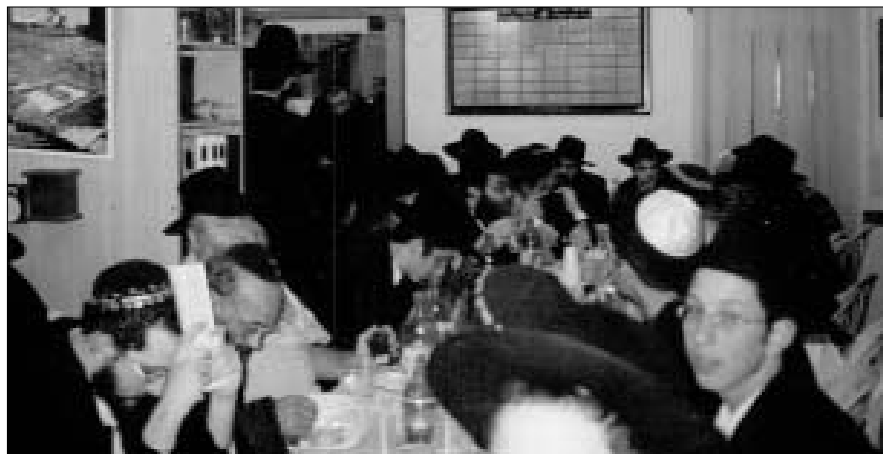
חלק מהקהל בעת סעודת המצווה

מפגן של אמונה, ביטחון ושמחה בהתגלות הרבי מה"מ שליט"א – כך ניתן להגדיר את מעמד הכנסת ספר תורה לבית הכנסת מרכז ממ"ש בנתניה, שהתקיים ביום שלישי ל' שבט.