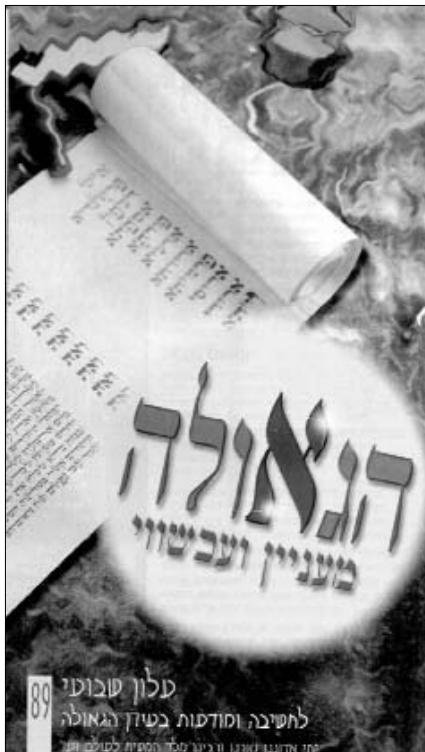
עלון "הגאולה מעניין ועכשווי" לחשיבה ומודעות בשידוך הגאולה