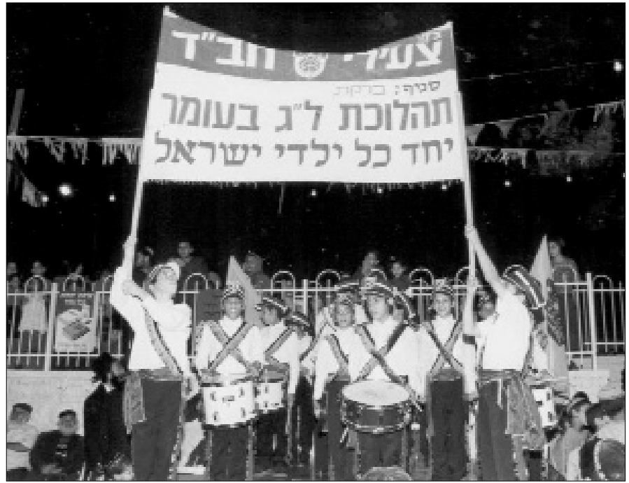
להקת המתופפים בתהלוכה הלילית בברקת