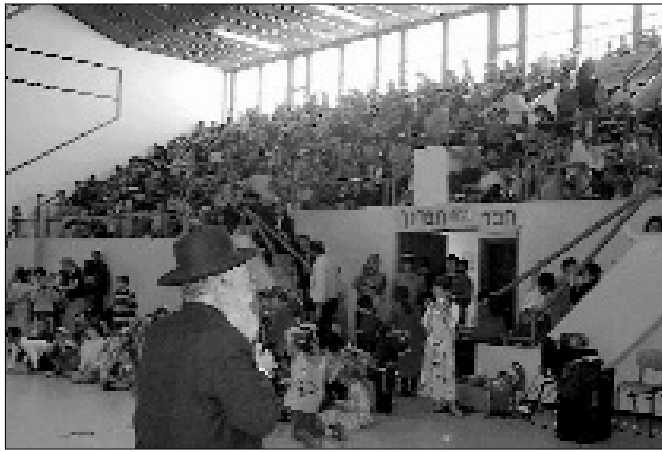
הרב דב ליאור נושא דברים בפני ילדי קרית ארבע