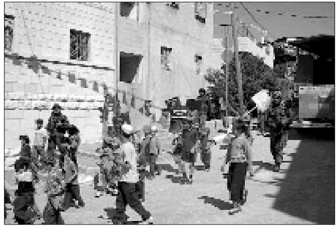
חיילי יחידות מיוחדות מלווים את ילדי חברון בתהלוכת ל"ג בעומר

הילדים בכינוסים שנערכו באופן של 'גאון יעקב', היו מעבר לכל הציפיות.