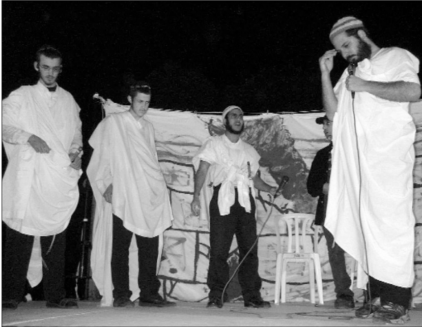
הצגה המרתקת "רפי ומכונת הזמן" לילדי רמת אביב בליל ל"ג בעומר