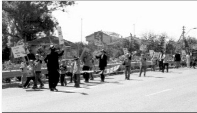
ילדי ישראל על פתח של כפר גדעון

את אחת התהלוכות ליוו שני טרקטורנים של משטרת נצרת עילית. שלושת התהלוכות שיצאו בו זמנית מהשכונות השונות, נפגשו