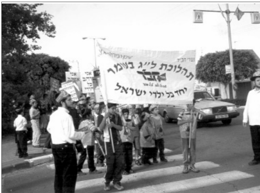
ילדי שיכון המזרח בתהלוכת ל"ג בעומר

המסיבה שהתקיימה במתנ"ס קרית גנים, יועדה לילדי השכונות 'נאות אשלים', 'קרית גנים' ו'קרית חתני פרס נובל'.