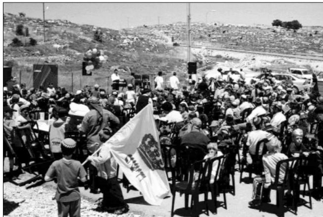
ילדי מטה בנימין בכינוס ל"ג בעומר