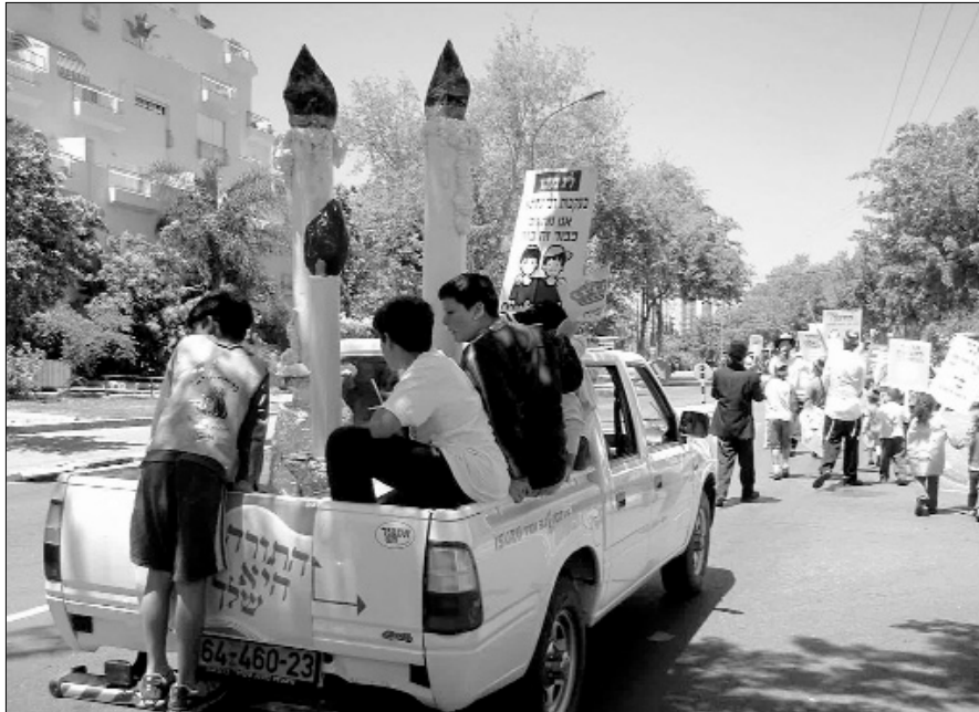
ילדי רמת ישי בתהלוכה ל"ג בעומר

בהמשך סופר לילדים סיפורו של התנא רבי שמעון בר יוחאי, ועל תלמידי ר"ע שפסקו מלמות ביום ל"ג בעומר. לאחר מכן צפו הילדים בהצגה מרתקת, אמרו את 12 הפסוקים ובסיום נערכה הגרלת פרסים.