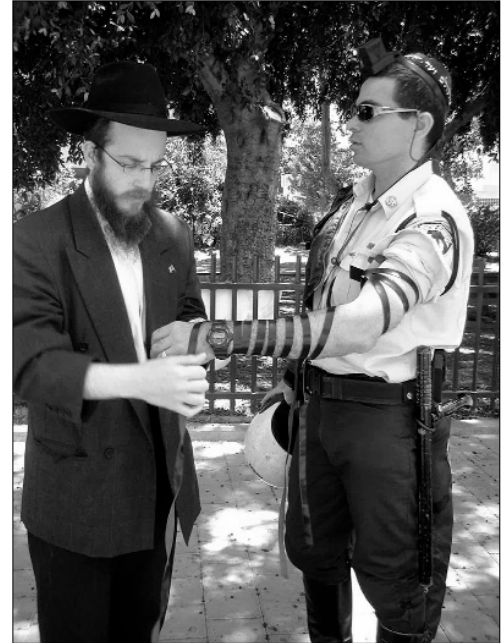
הנחת תפילין לאחד השוטרים המפקחים על התהלוכה בתל אביב

חגיגות ל"ג בעומר בחולון החלו בשעות הצהריים המוקדמות, בכינוס שנערך במתנ"ס וולפסון, בהשתתפות מאות ילדים – תלמידי תלמודי-תורה, בתי-ספר ממ"ד ובתי-ספר ממלכתיים בעיר.