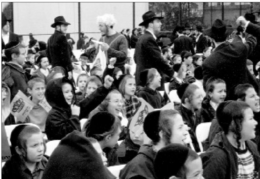
עשרות דגלי משיח צבעוניים התנוססו בתהלוכה

בהגרת הענק שנערכה בכינוס, זכו ילדים מחוגים שונים בסטים גדולים של ספרי חסידות ונגלה. לאחר הכינוס השתתפו הילדים בלונה-פארק מיוחד שהוקם במקום.