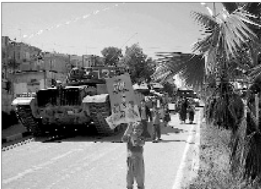
אות בספר התורה שומרת ומגנת. טנק אמיתי ברחובות חברון בשעת התהלוכה