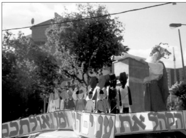
המלך קורא בהקהל, אחת מהתצוגות של התהלכה בשיכון ה'