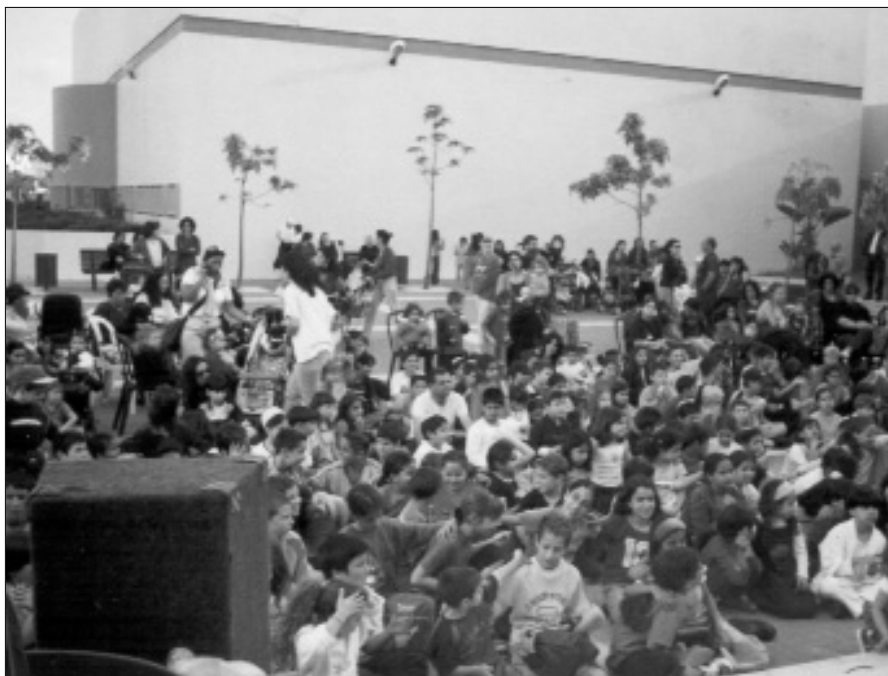
כינוס ל"ג בעומר הראשון בשכונות החדשות של ראשון לציון