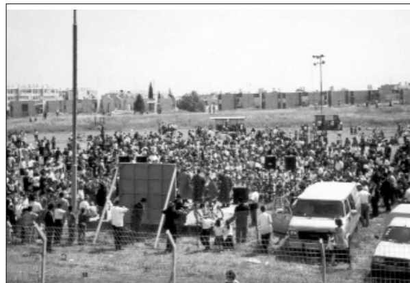
התהלוכה בקריית מלאכי

הפסוק, הובא לתהלוכה עדר כבשים מונחים על ידי רועים בדואים תושבי הנגב. את עדר הכבשים ליווה הרב אברהם (בומי) פרידלנד , שהלהיב את הילדים בשירה ובאמירת פסוקים תוך כדי שהוא זורק סוכריות לעבר הילדים.