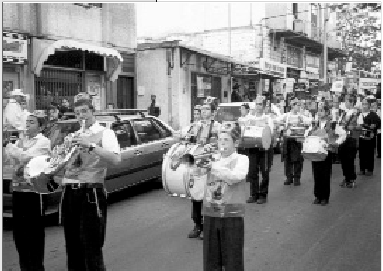
ילדי צפת ניגנו בתהלוכות רבות במשך היממה של ל"ג בעומר