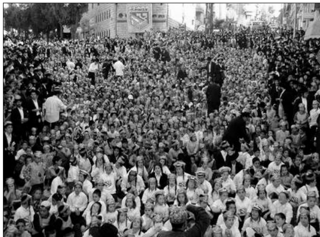
רבבות ילדים בכיכר השבת בירושלים