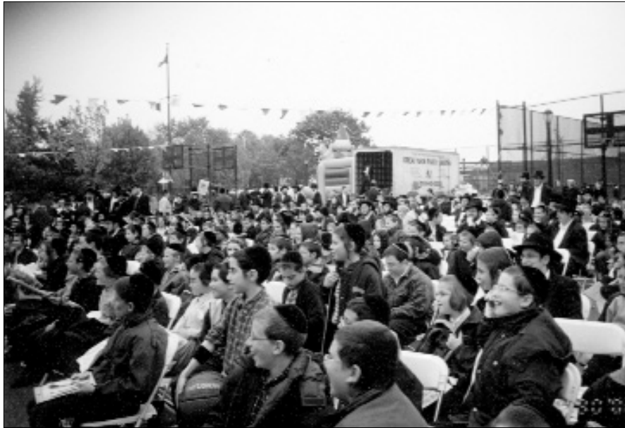
אלפי ילדים בכינוס בבורו פארק

אלפי ילדים השתתפו בתהלוכת ילדי ישראל בשכונה החרדית בורו פארק. התהלוכה עברה ברחובות הראשיים של השכונה, כשהילדים נושאים שלטים אודות גאולה ומשיח, אהבת ישראל ושאר מבצעי הקודש, בלשון הקודש, באידיש ובאנגלית. חלק גדול מהילדים נופפו בגאווה בדגלי משיח ודגלי צבאות ה'.