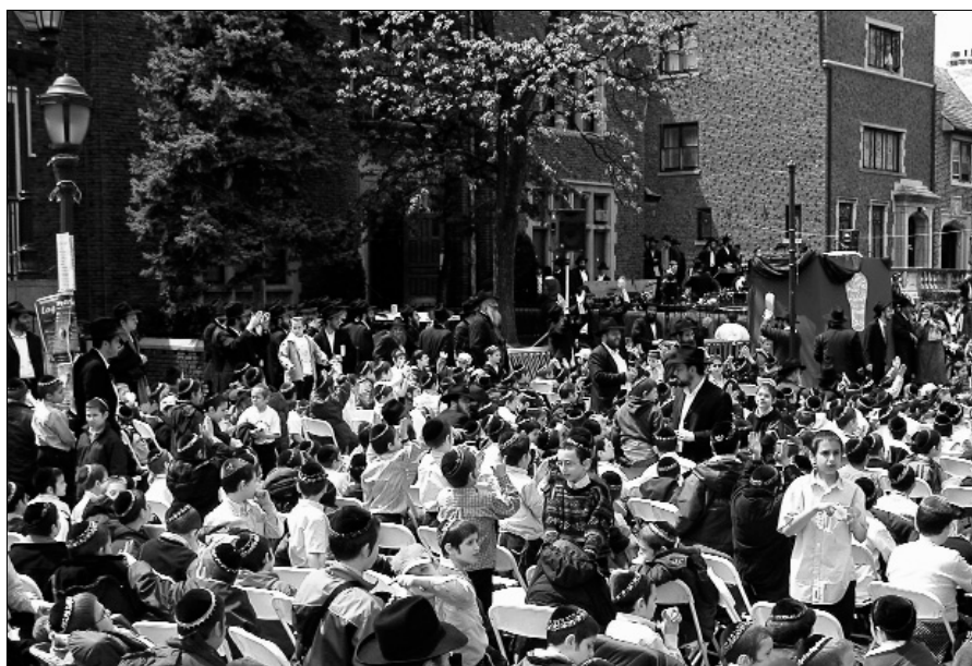
בציפייה וגעגועים. בימה מיוחדת הוכנה לכ"ק אדמו"ר מלך המשיח שליט"א

ביום שלישי לייג בעומר התקיים הכינוס של לייג בעומר, בחזית 770, בהשתתפות כל מוסדות החינוך בשכונת קראון הייטס, "כאן ציווה ה' את הברכה". הכינוס אורגן על-ידי ארגון "צבאות ה"י העולמי.