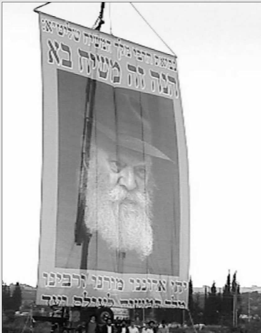
הנה הנה משיח בא – ראו כל הבאים למירון במשך 24 השעות של ל"ג בעומר