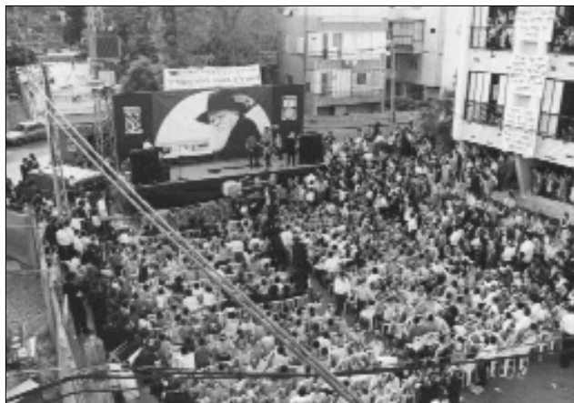
קידוש ה' בכיכר ברטנורא בבני ברק

והכיתוב: "כינוס ותהלוכת ל"ג בעומר לילדי תשב"ר שנת הקהל שנת המאה להולדת הרבי".