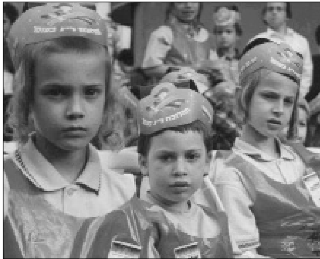
ילדים מחוגים שונים השתתפו בתהלכות ברחבי הארץ

החלק המרכזי בתכנית האומנותית היה תיאטרון בובות שהמחיש הצגה בנושא אהבת ישראל. לסיום נערכה הגרלה נושאת פרסים יקרים.