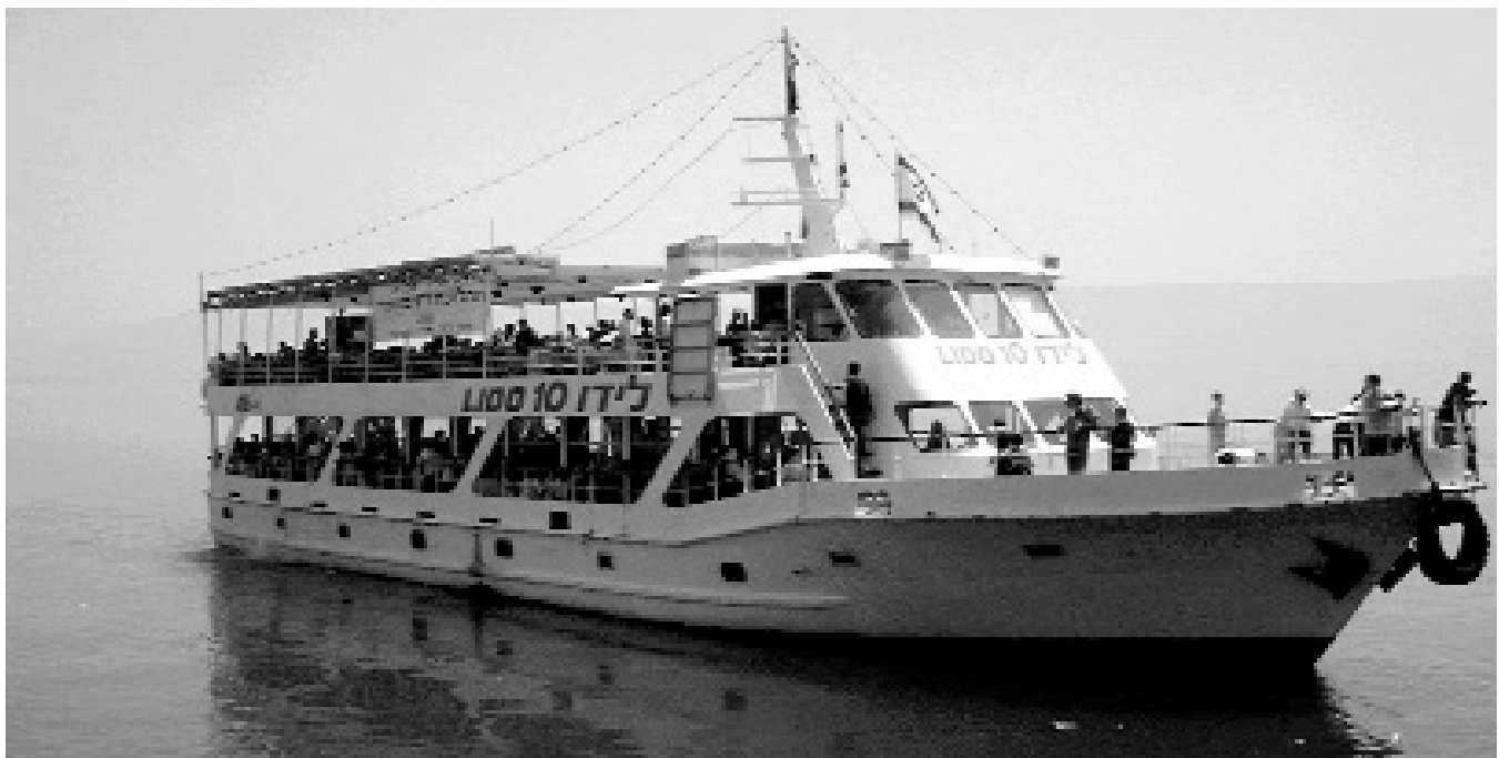
כאלפיים ילדים בתהלוכה על המים