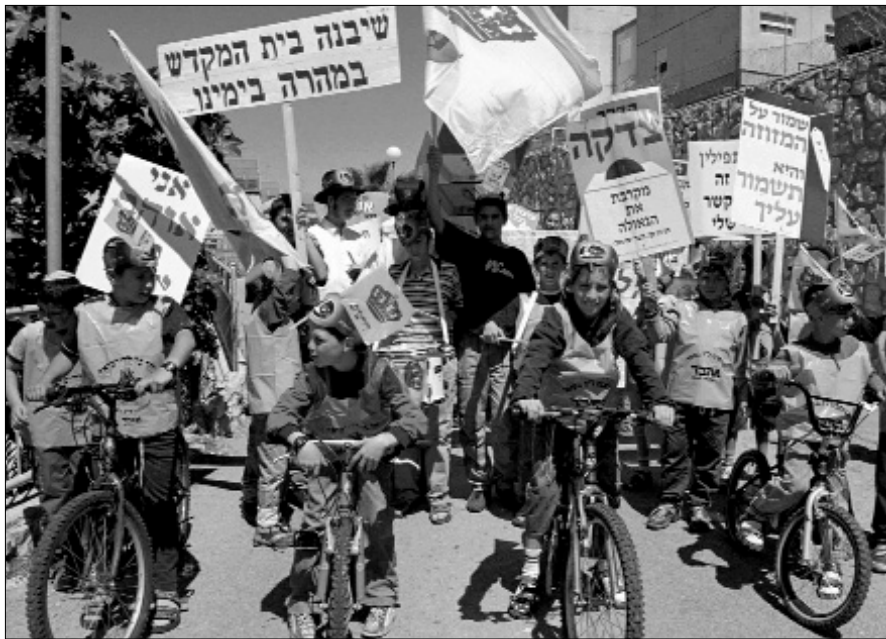
תפילה מעומק הלב "שיבנה בית המקדש במהרה בימינו"