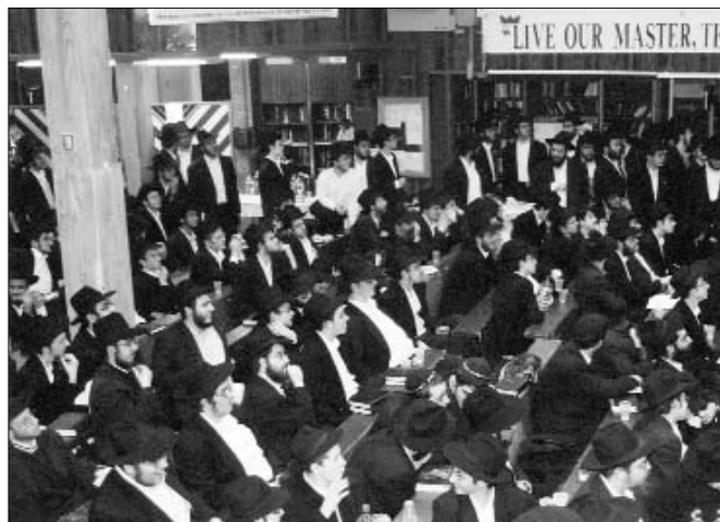
חלק מהתמימים בטקס חלוקת הפרסים

השתתפות שיא. השיחות והמאמר נלמדים בחיות רבה, ובכל מקום ניתן לשמוע תמימים המדברים על ענייני חג השבועות, כפי שהם מבוארים בספר החדש, לקוטי שיחות בענייני גאולה ומשיח, שיחות שבועות אי ובי.