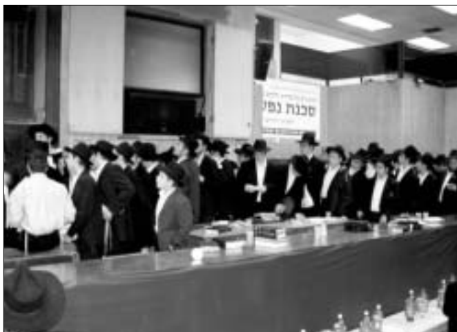
עשרות תמימים מצטיינים עומדים בתור לחלוקת הפרסים