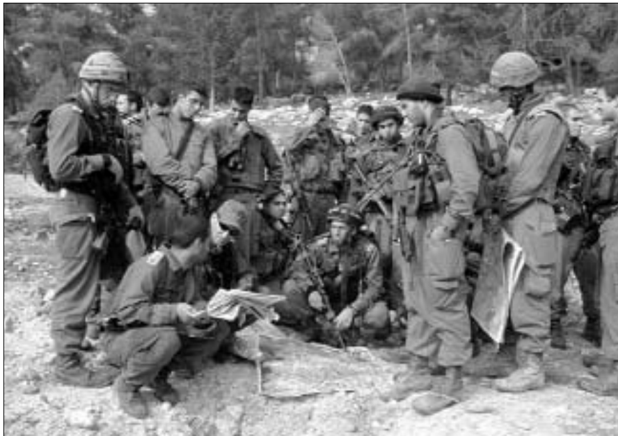
תדרוך לפני יציאה לקרב

ר"ל, ולא רק בארץ הקודש אלא גם במדינות אחרות, ומי יודע שבעת דיבורי אלה, הרי "לא תפתח פה וכו'" ברגע זה ממש לא אירע משהו ליהודי, היל"ת, כי עוד ידם נטויה..."