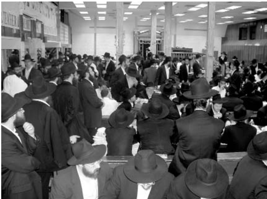
חלק מקהל המתוועדים בהתוועדות המרכזית שנערכה ב"בית חיינו" במוצאי שבת

רבבות חסידי חבי"ד בעולם כולו ציינו ביום השבת קודש, וביום ראשון – י"ב וייג תמוז – את יובל השבעים וחמש לגאולתו של כ"ק אדמו"ר מהוריי"צ נייע ממאסרו בידי הקומוניסטים 'בעוון' הפצת היהדות וחסידות.