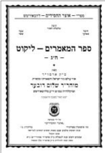
שער הספר החדש

יהי רצון – כסיום בפתח דברי של הספר – שנזכה בקרוב ממש למסמך גאולה לגאולה האמיתית והשלימה, וכ"ק אדמו"ר מלך המשיח יוליכנו קוממיות לארצנו הקדושה. וזכות גילויים והדפסתם של מאמרים חדשים אלו, תזרו את התגלותה של ה"תורה חדשה מאתי תצא", ונלמוד תורה מפיו של משיח צדקנו, תיכף ומיד ממש, אמן כן יהי רצון.