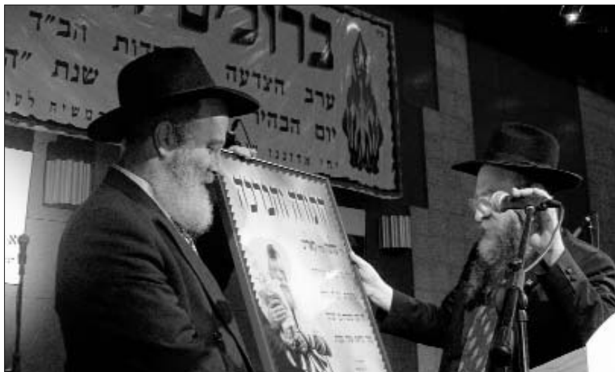
הנגיד החסידי פרופ' שלמה קאליש מקבל תעודת הוקרה

באולם הקונגרסים בבנייני האומה שררה ביום ראשון בערב, מוצאי י"ג בתמוז, אווירה חגיגית מיוחדת. מאות מידידי בית חב"ד גילה הגיעו להצדיע לבית חב"ד שעושה רבות למען התושבים המצויים בחזית.