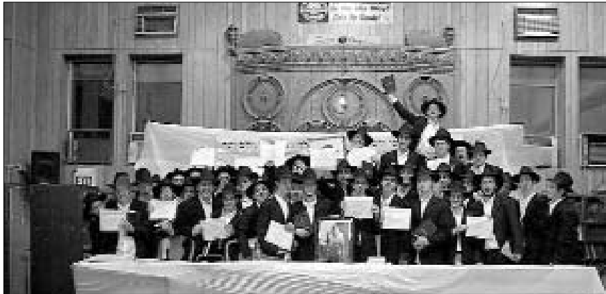
חלק מהתמימים שקיבלו תעודות הוקרה