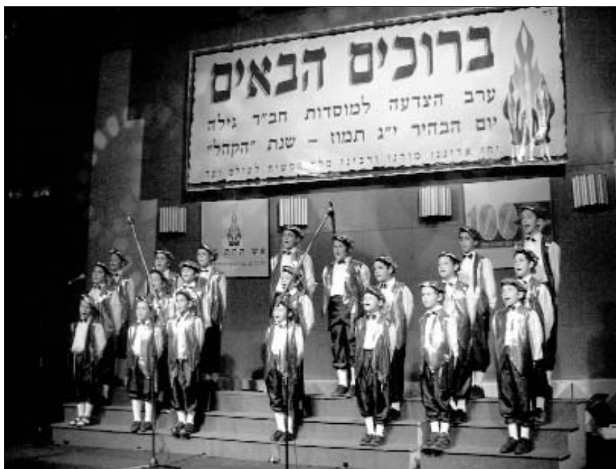
מקהלת תלמוד תורה מקדמת בשיר וזמר את באי הדינר