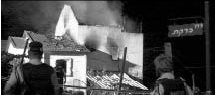
זירת הפיגוע ביישוב איתמר

הפיגוע באיתמר בו נהרגו אם ושלושת ילדיה וכן רכז הביטחון ביישוב היידי, זעזע כל יהודי באשר הוא. כך, בשעת ערב מאוחרת נכנס מחבל לבית משפחת שבו והרג את כל מי שנקרה בדרכו.