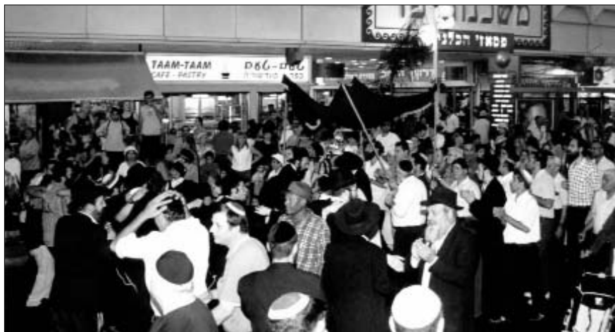
קהל האלפים שמח בשמחת התורה ברחובות העיר