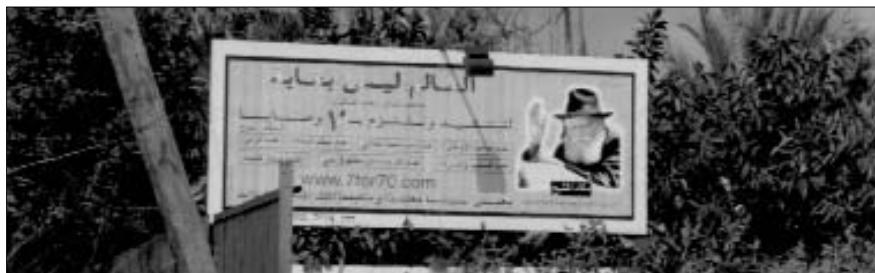
שלט ענק הקורא לקיום שבע מצוות בני נח בשפה הערבית