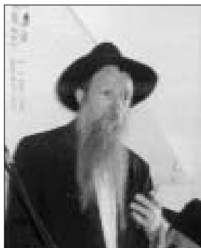
הרב טוביה בולטון