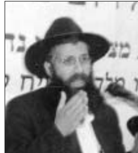
הרב יחזקאל נואימה