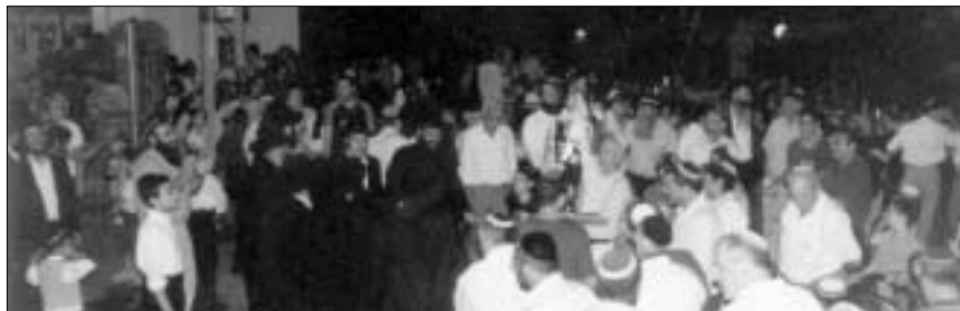
ריקודי ההקפות ברחבת בית הכנסת