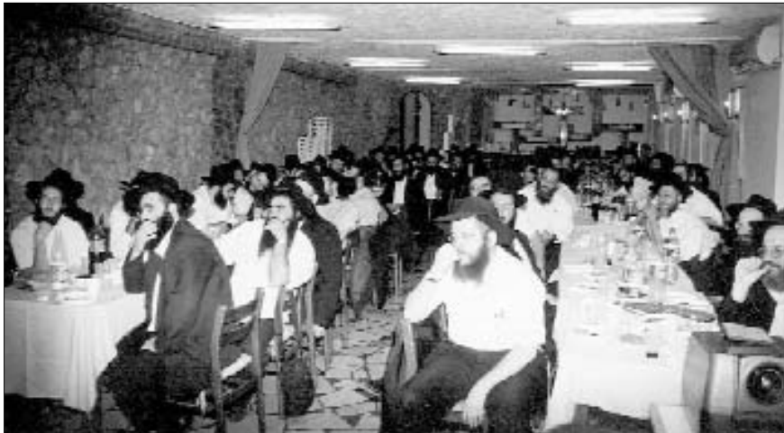
חלק מקהל הבוגרים בכנס 'הקהל'