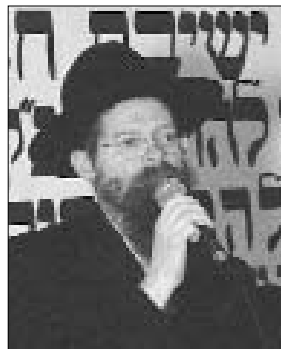
הרב שלמה זלמן לבקיבקר מראשי הישיבה