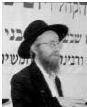
הרב זלמן נוטיק