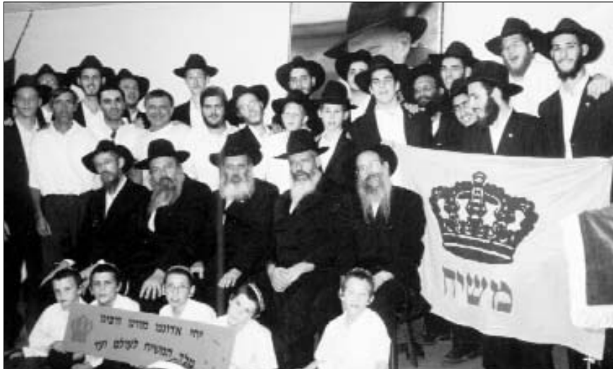
תמונה קבוצתית למשתתפי 'שבת שכולה משיח' בקרית אונו