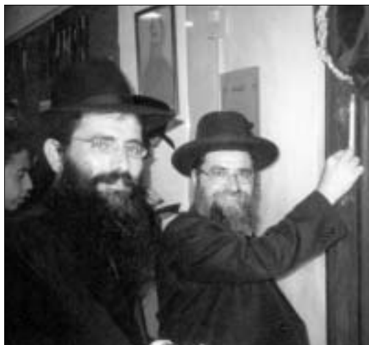
הרב המקומי קובע מזווה בפתח בית חב"ד