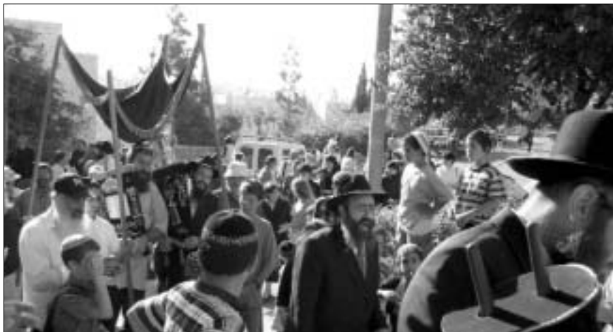
התהלוכה ברחובות קרית ארבע ברוב שירה וזמרה

כתיבת האותיות האחרונות התקיימה בבנין הישיבה, ולאחר מכן יצאה תהלוכה