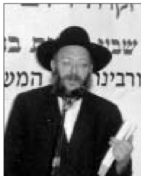
הרב יוסף יצחק ווילשאנסקי