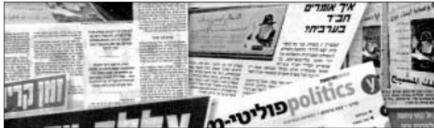
פרסומים בכלי התקשורת

חושב. סרגיי, גוי שעלה מחבר העמים לארץ, סיפר כיצד הרב מיכאל גוצל שיכנע אותו לקיים את שבע המצוות. הוא סיפר כי ביקש לדעת מהו בית כנסת וכך הגיע אל מיכאל גוצל. "אני מאוד מתלהב מהעובדה שיש לנו מצוות אותם עלינו לקיים", אמר.